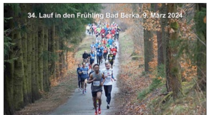
34. Lauf in den Frühling Bad Berka, 9. März 2024

Am 9. März startet um 10:00 Uhr der traditionelle „Lauf in den Frühling“ im Ilmtalstadion Bad Berka als erster Volkslauf des Jahres im Weimarer Land.