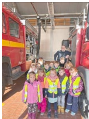
(Stellvertretend zwei Fotos - Luftrettung und Feuerwehr)