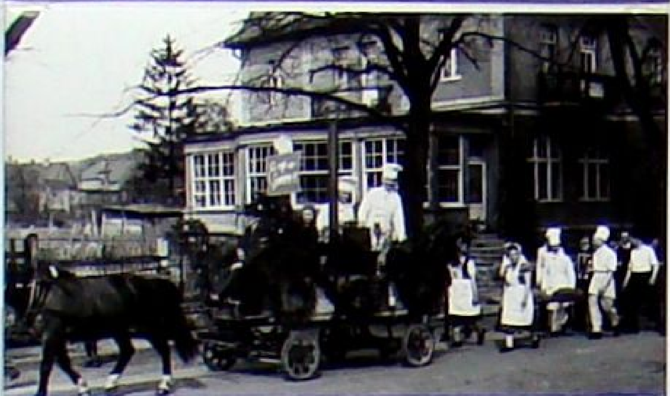
Gemeinsam, mit zahlreichen Zuschauern zogen Einzelhändler, Verkäufer, Bäcker und Fleischer sowie ihre Gegner, die Gastwirte, Köche und Kellner zum Sportplatz.

Anlässlich des 1. Mai 1950 fand am Vortag ein humoristisches Fußballspiel zwischen Bad Berkas Einzelhandel und den Gastwirten statt. Unter Beifall und dem Gelächter von mehreren Hundert Zuschauern bewegten sich 22 zum Teil sehr abenteuerlich aussehende Gestalten auf dem Spielfeld. Es waren im Ort gut bekannte Personen, die damals im Einzelhandel und in Gaststätten arbeiteten. Wie das Spiel endete ist leider nicht mehr bekannt!