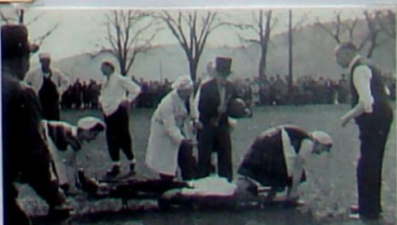
Auch Verletzte waren zu beklagen!