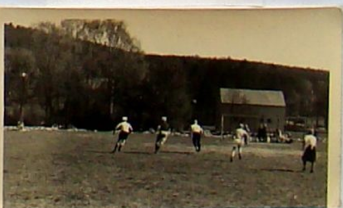
Impressionen vom Spiel und der Halbzeit