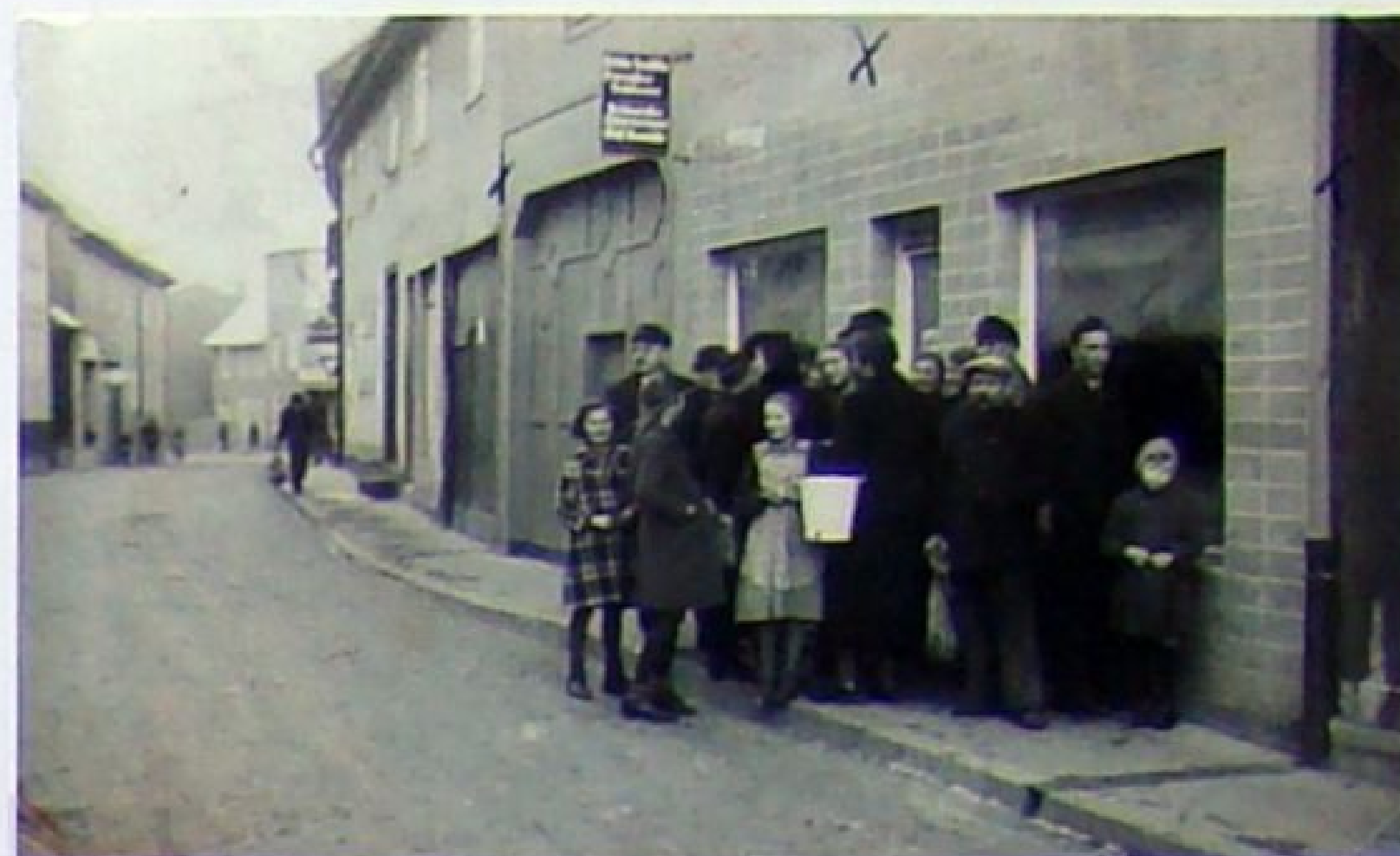
Schlangen gehörten zu jedem Geschäft in den schweren Nachkriegsjahren nach 1945