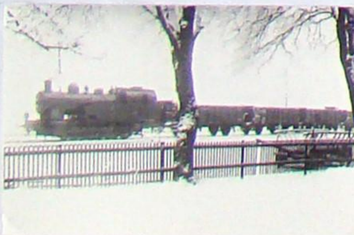
Güterzug mit Lok 92 in Bad Berka 1938