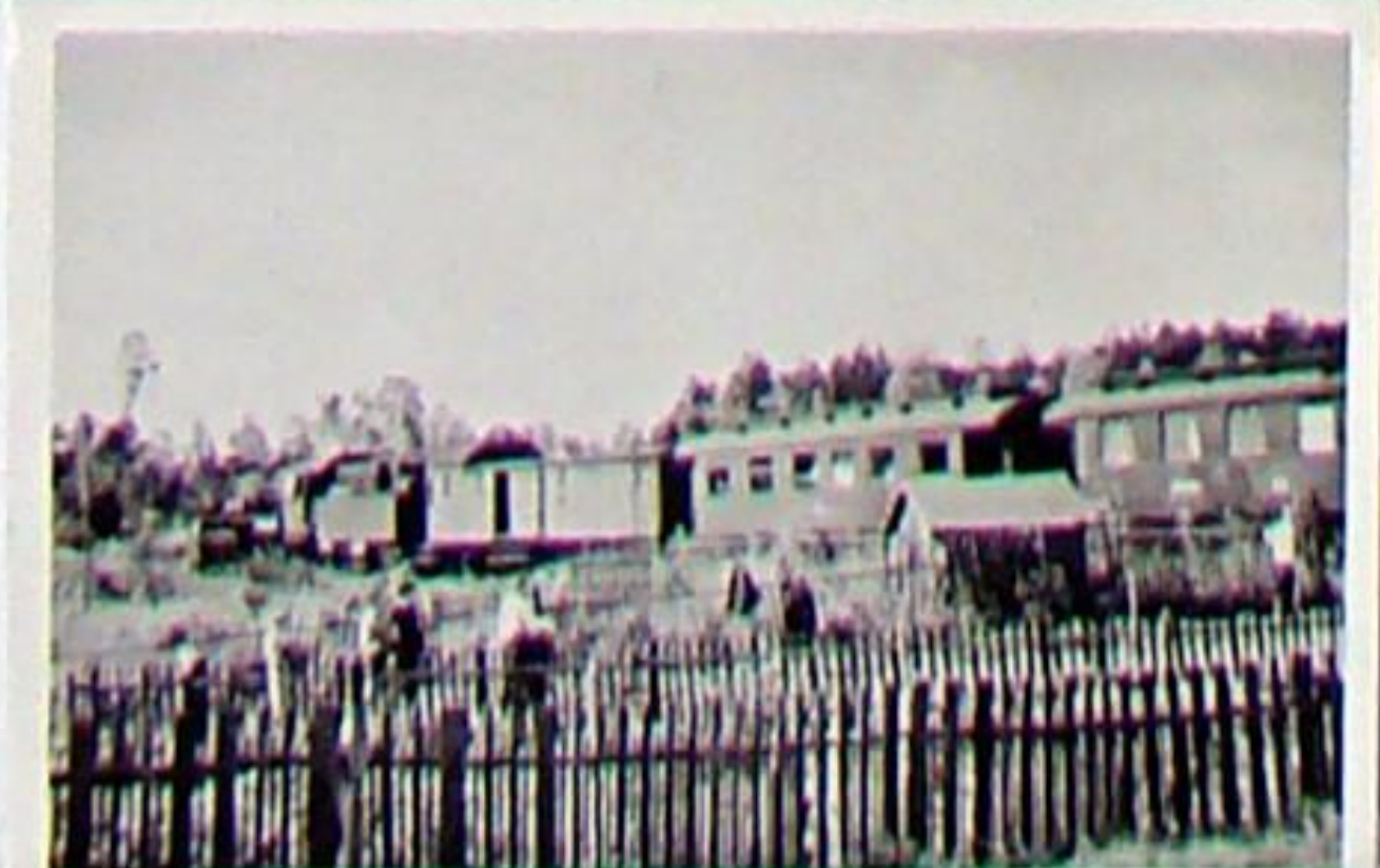
einfahrender Personenzug mit Lok 58 1424 in Blankenhain um 1955