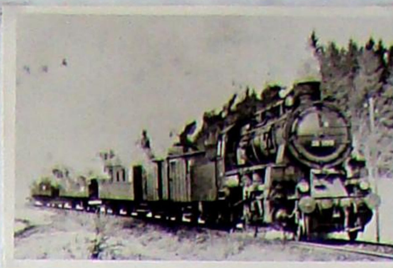
Lok 58 1190 mit Personenzug vor Kilometer 5,0 in der Krakaukurve auf der Fahrt nach Blankenhain (Thüringen) - 1958