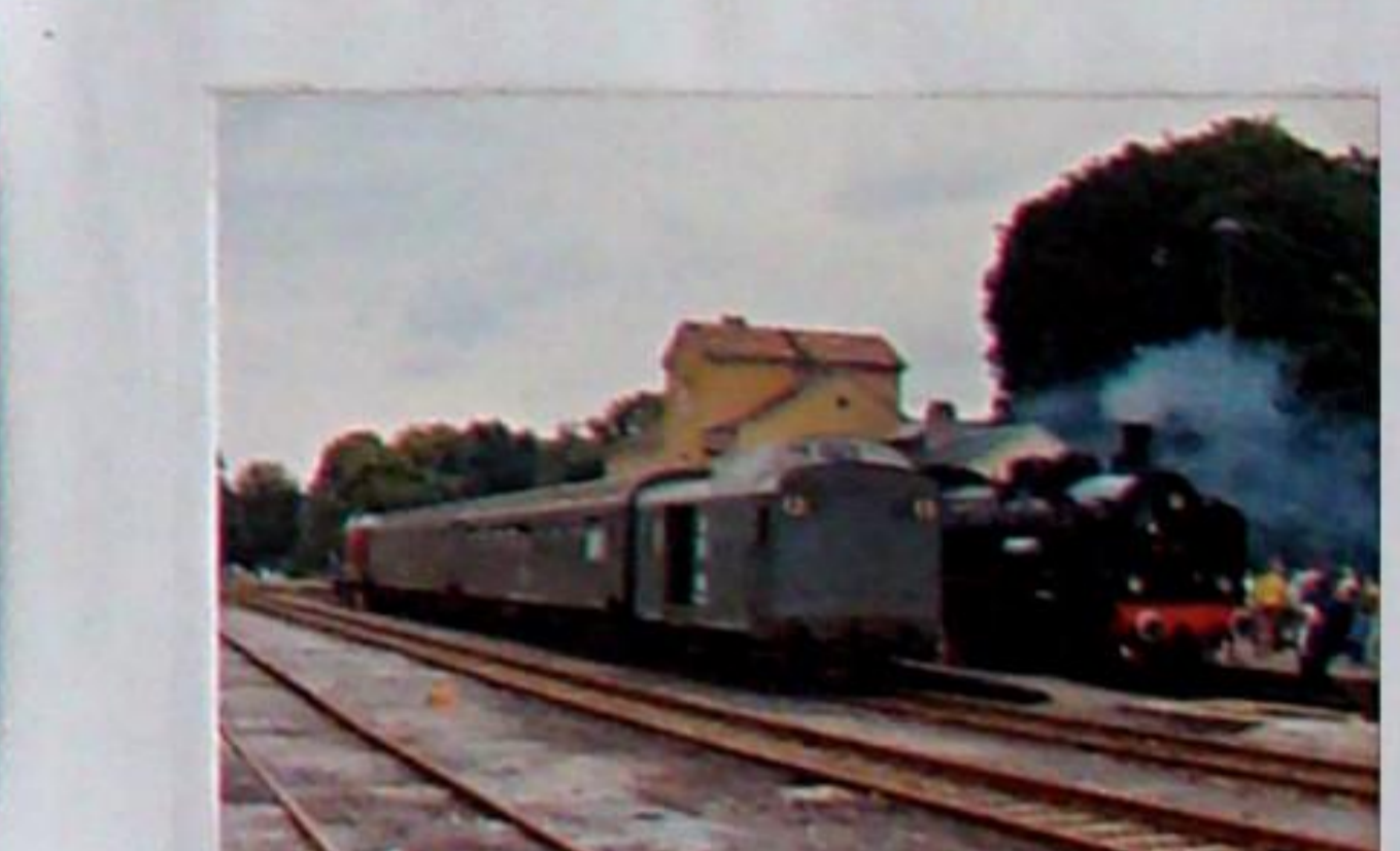
Zugkreuzung in Bad Berka zur Nostalgiefahrt im August 1991 von Weimar nach Kranichfeld