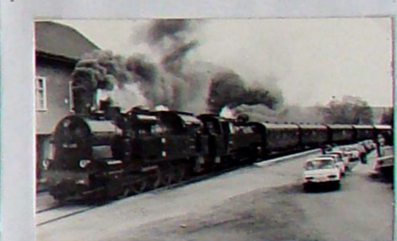
Heimfahrt des Sonderzuges mit Lok 94 1292, 86 056 und dem Veltener Traditionszug nach Weimar