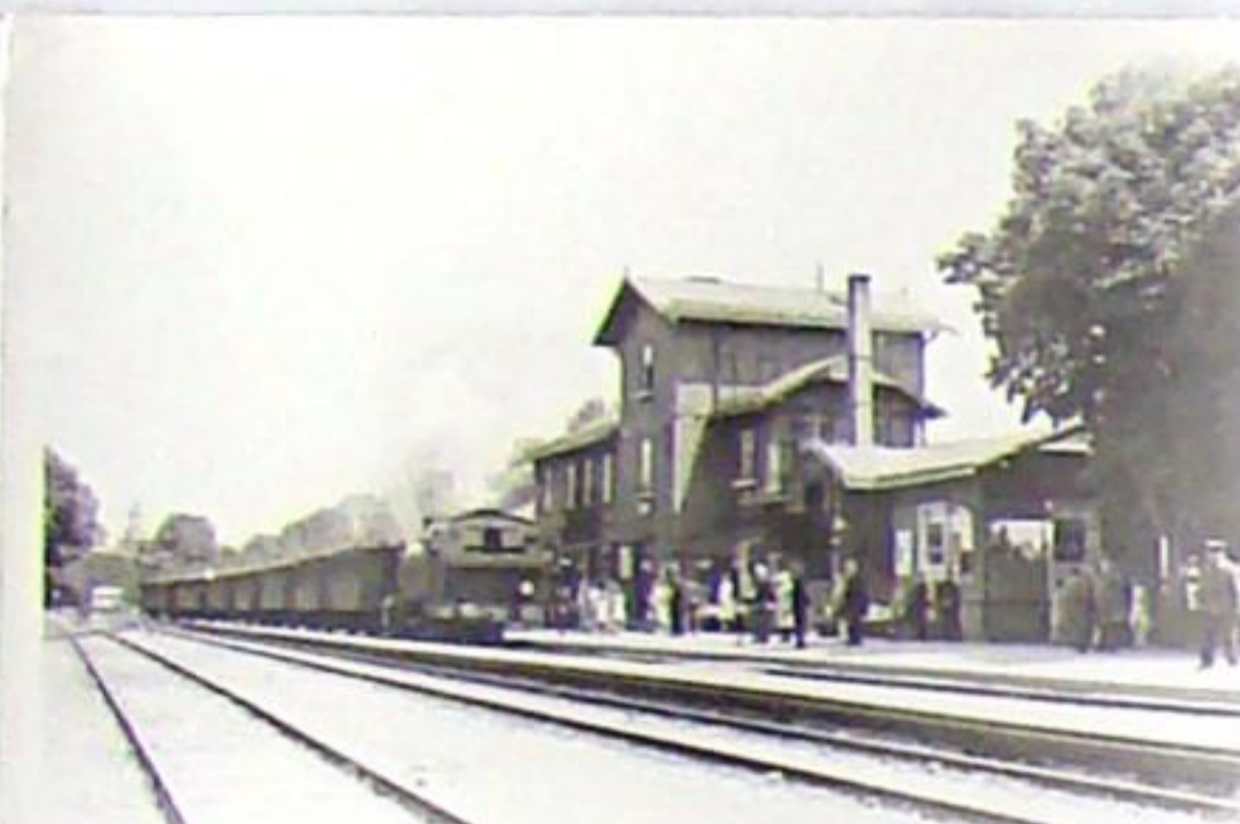
Das Bahnhofsgebäude in Bad Berka 1928 mit einfahrendem Personenzug und Lok 92