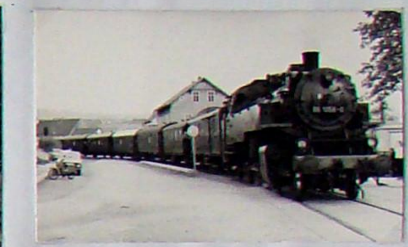
Einfahrender Sonderzug mit Lok 86 056 zum 100jährigen Eisenbahnjubiläum am 16.05.1987 in Bad Berka.