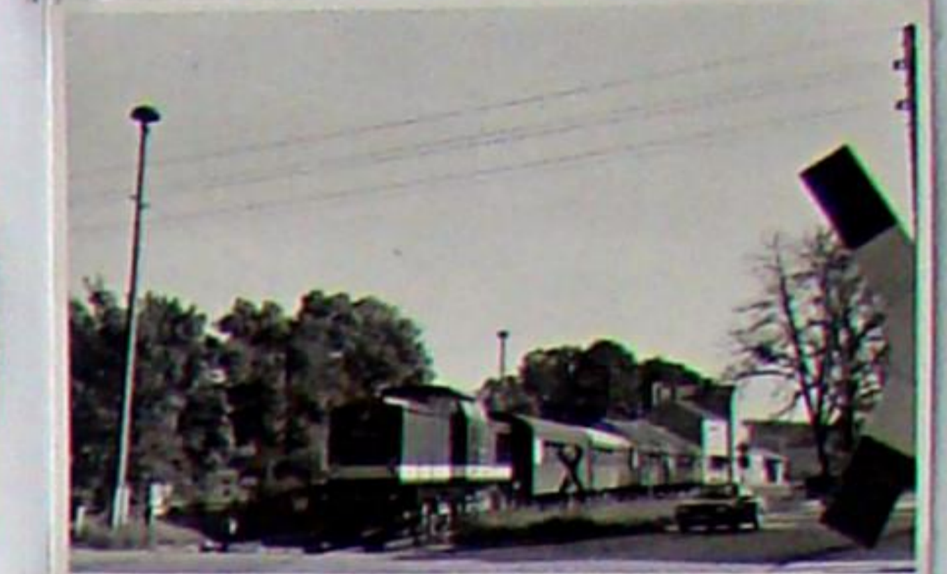
Bad Berka am 25.7.1984: Personenzug am unbeschränkten Bahnübergang neben dem Kurhotel mit zwei- und dreiachsigen Rekowagen