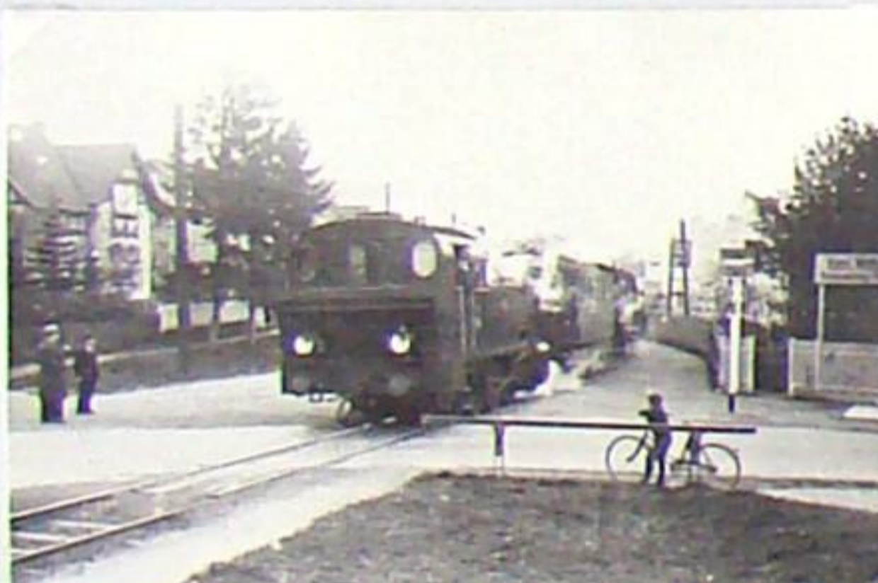
einfahrender Personenzug von Weimar in den Bahnhof Bad Berka um 1935