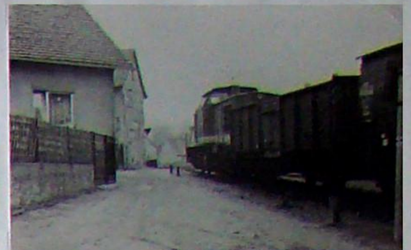
110 294-6 als Schiebelok bei der Durchfahrt durch Bad Berka nach Weimar am 10.4.1982