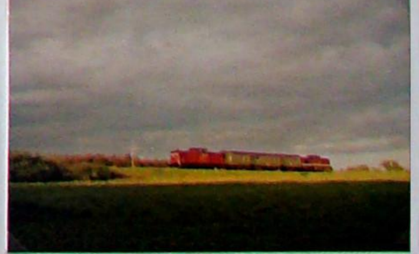
Sandwich-Zug am 21.5.1998 (Himmelfahrt) zwischen Bahnhof Holzdorf und Autobahn mit zwei Loks der BR 204