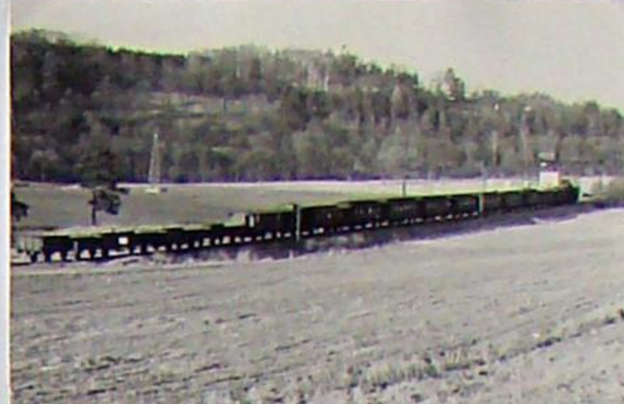
Doppelpersonenzug mit angehängten Güterwagen auf der Fahrt zwischen München und Bad Berka, rechts die ehem. Kohleverladung für die Zentralklinik - 1962