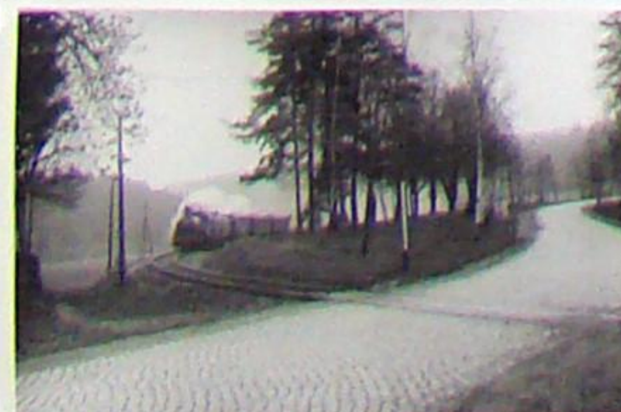
Sonderzug am Bahnübergang Legefild um 1938