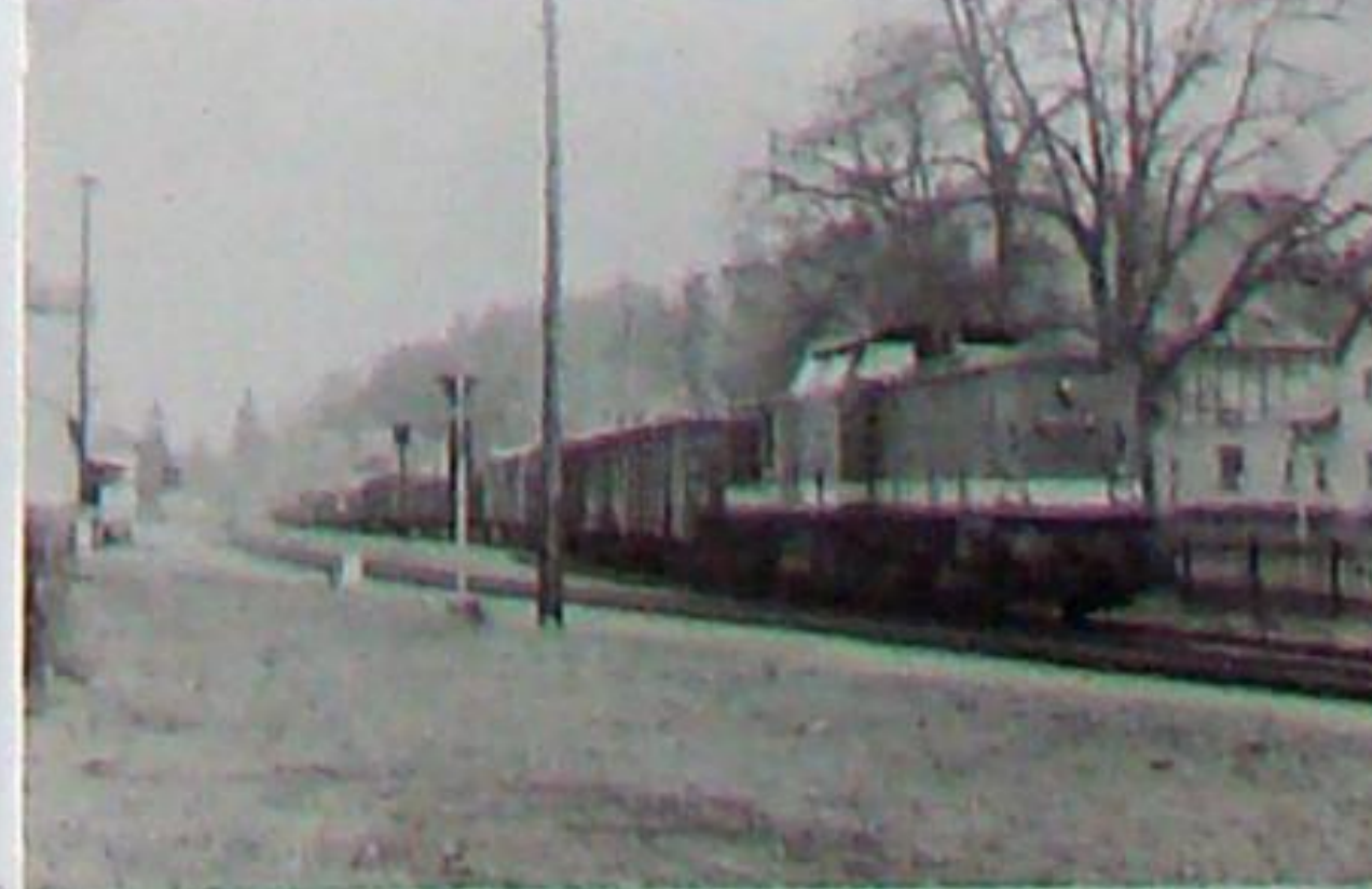
Zuglok 106 428-6 und Schiebelok 110 294-6 fahren am 10.4.1982 mit Güterzug von Weimar in den Bahnhof Bad Berka ein.