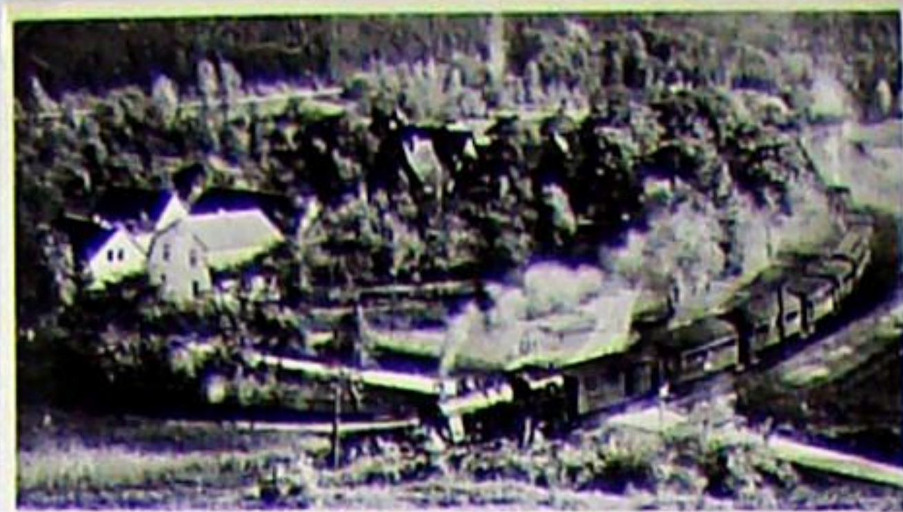
Strecke auf Hetschburg a. d. Thier Doppelpersonenzug auf der Fahrt von Bad Berka nach Weimar bei Hetschburg 1940