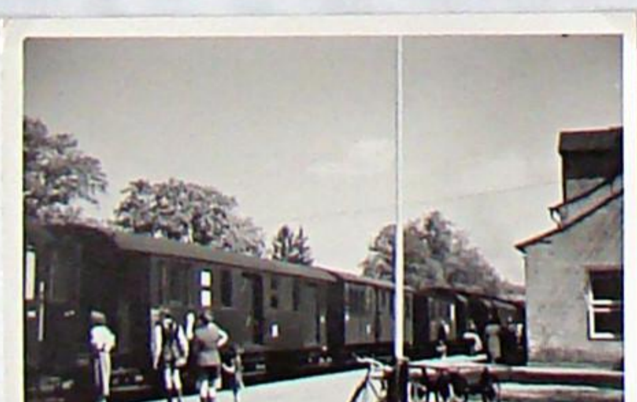
Am Bahnsteig 1 in Bad Berka steht um 1953 ein Doppelpersonenzug zur Ausfahrt nach Weimar bereit, links der ehem. Packwagen Nr. 29