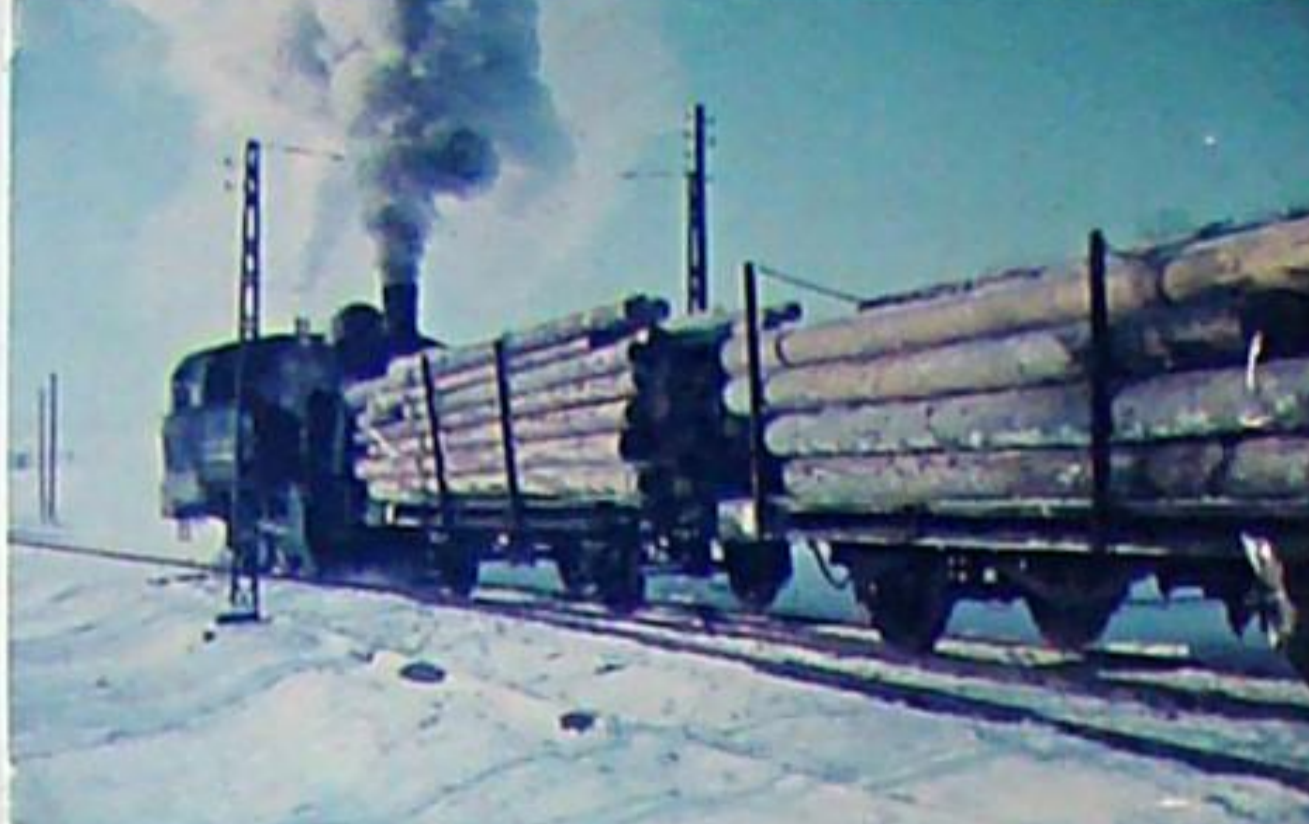
Holztransport auf der Weimar - Bad Berkaer Strecke