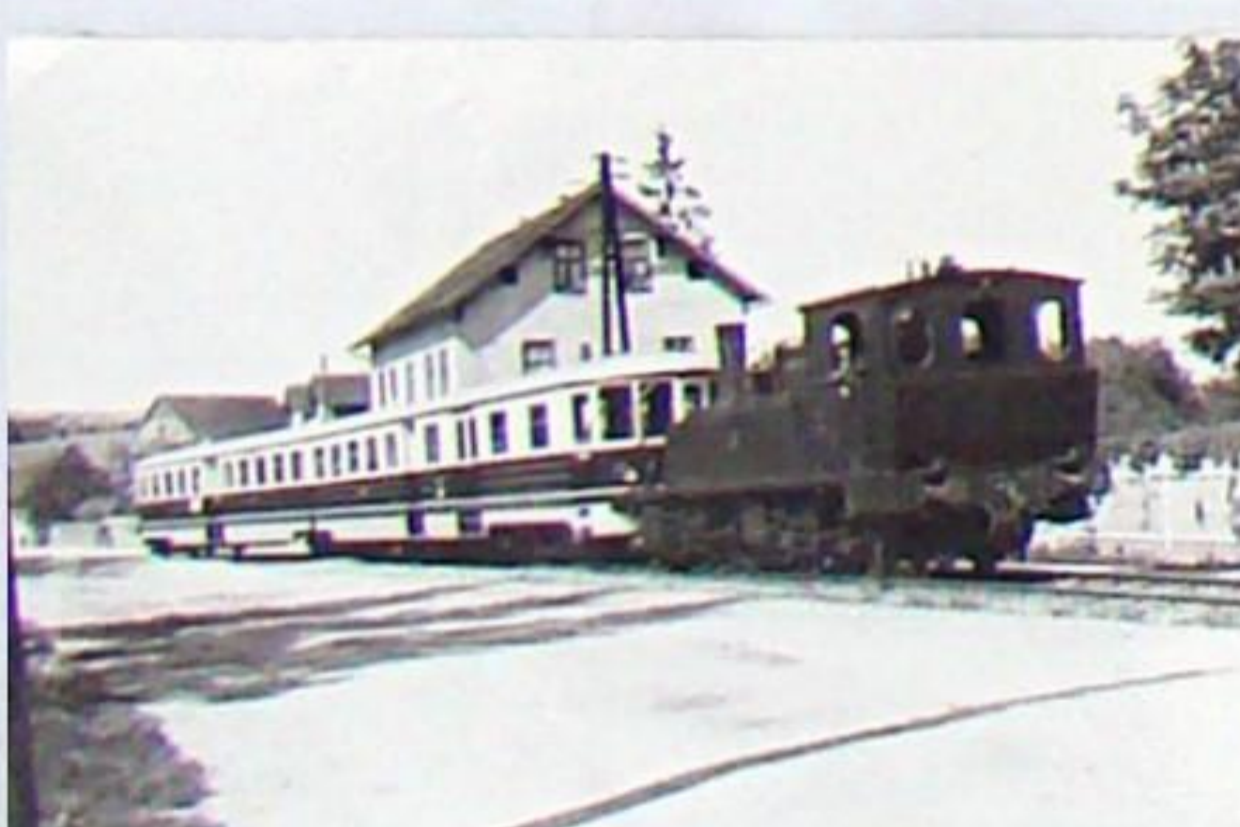
Abschleppen des defekten Triebwagens T 05 durch die Malletlok 86 in der Ortslage Bad Berka 1936