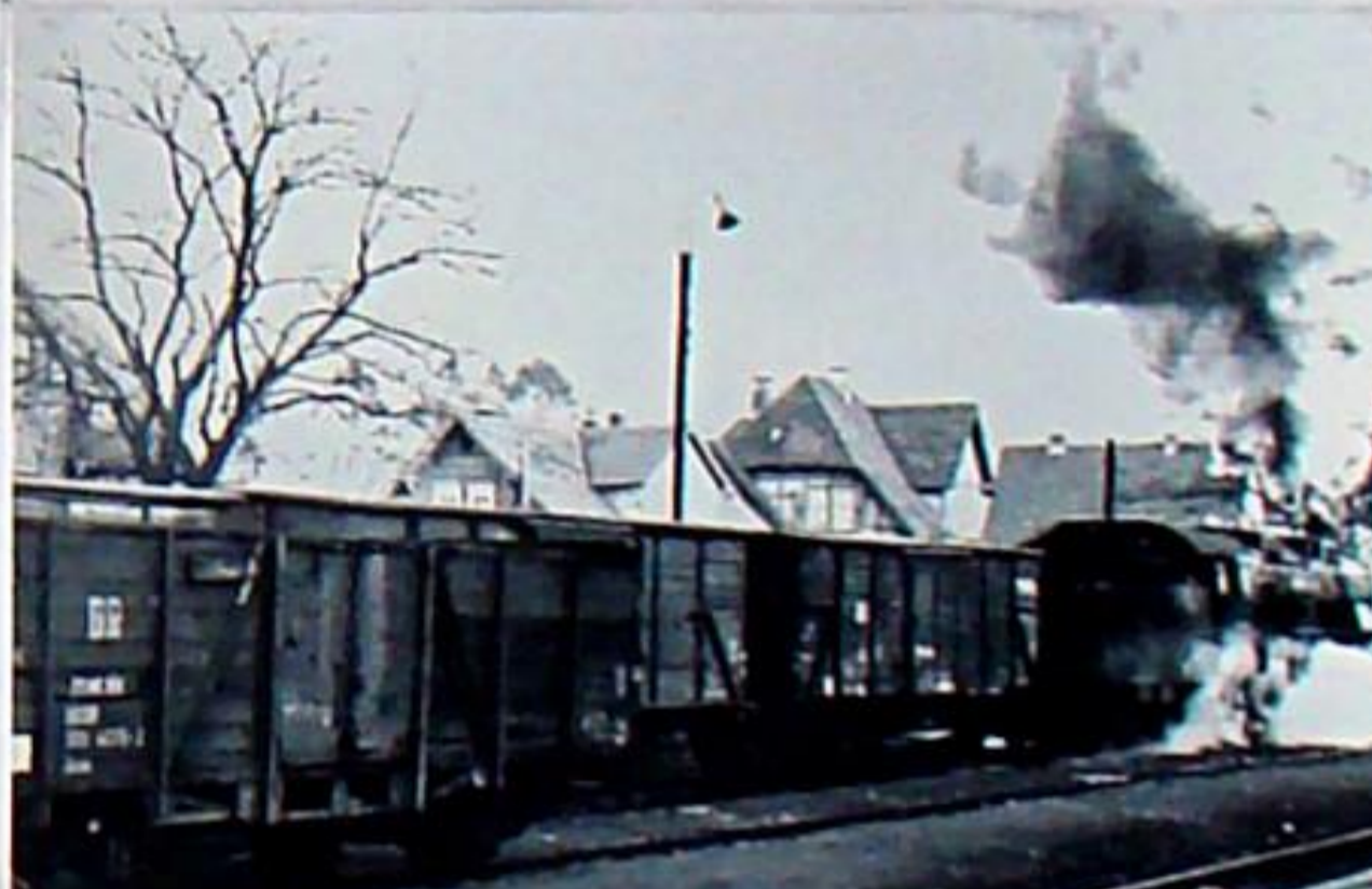
ausfahrender Güterzug aus Gleis 3 in Bad Berka nach Weimar Anfang 1968