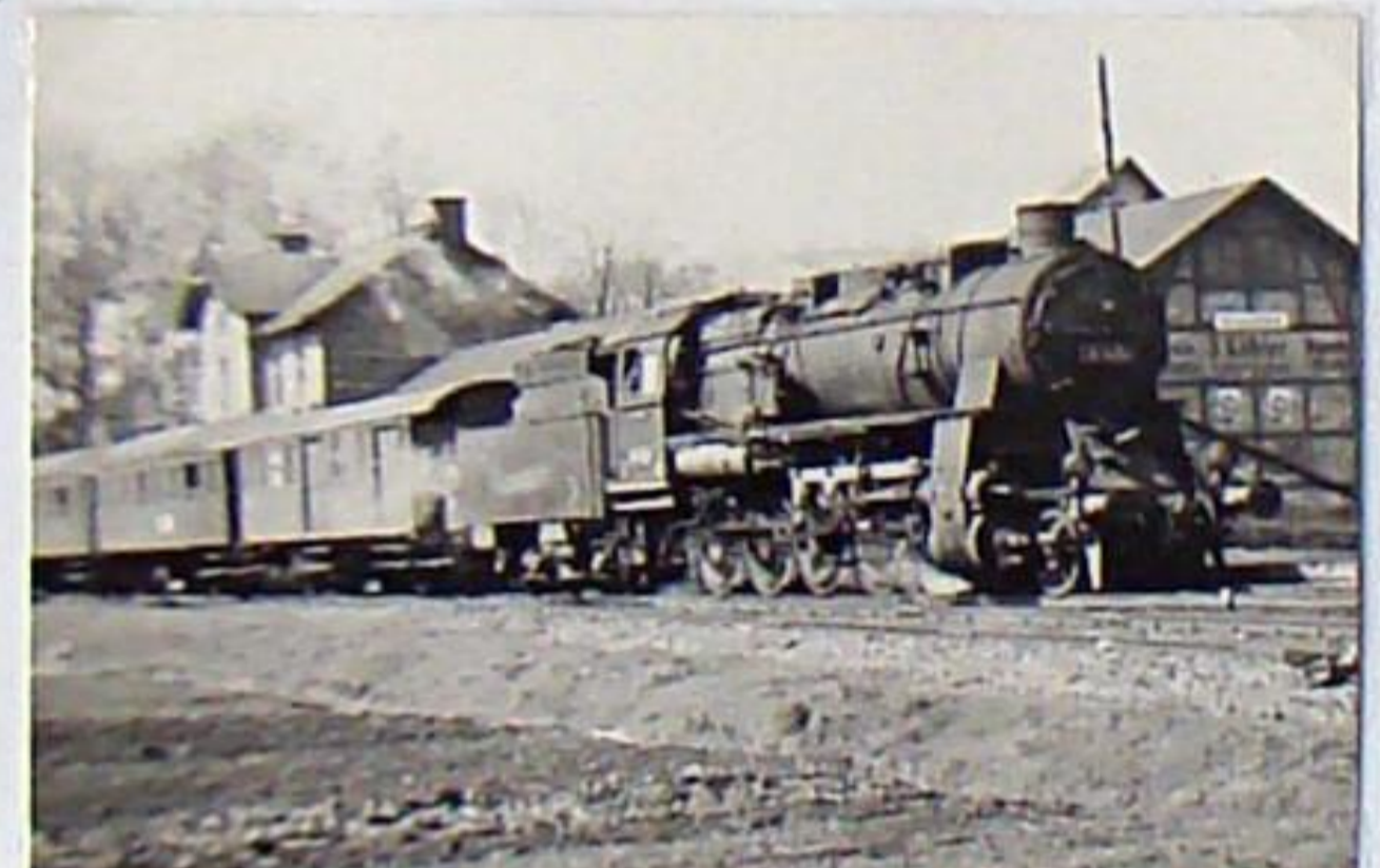
Lok 58 1454 mit Personenzug bestehend aus umgebauten Aussichtswagen und dem ehem. Pwi Nr. 29 in Kranichfeld - 1953