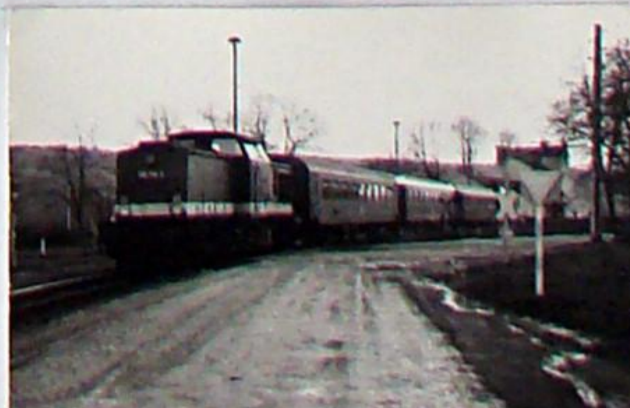
13.11. 1981: aus Bad Berka in Richtung Weimar ausfahrender Personenzug mit Diesellok 110 314 mit einem vierachsigen Rekowagen und zwei Altbau-Liegewagen des Umbaujahres 1950