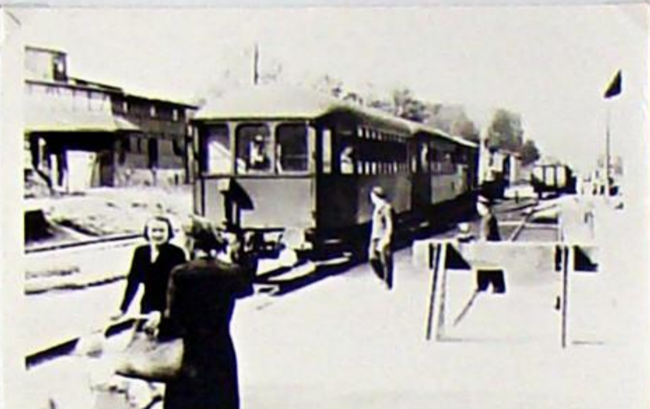
Sommer 1950: ausfahrender Personenzug aus dem Bahnhof in Blankenhain