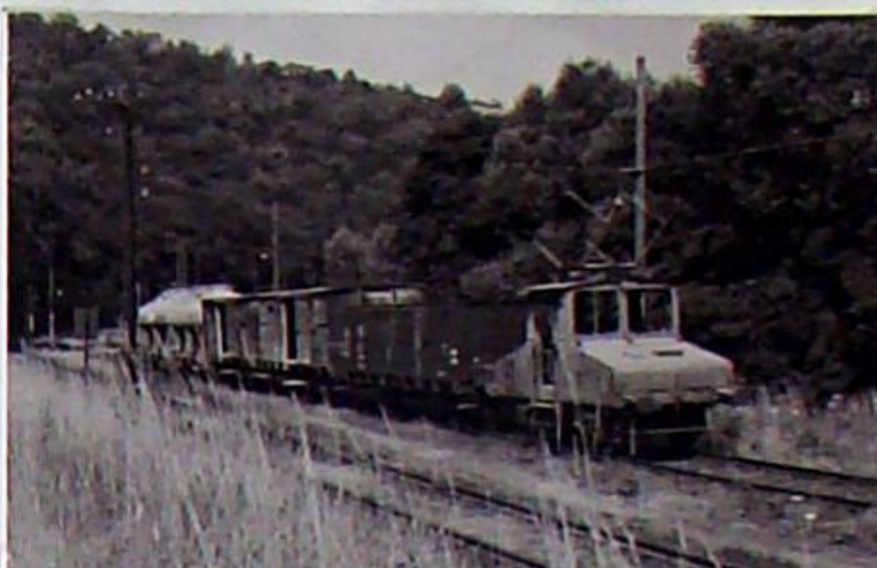
Sommer 1967 - die alte Werklok 1 des Zementwerkes Bad Berka steht mit einigen Güterwagen auf dem Ausziehgleis vor den Übergabgleisen. Vorm das Streckengleis Hetschburg - Bad Berka.