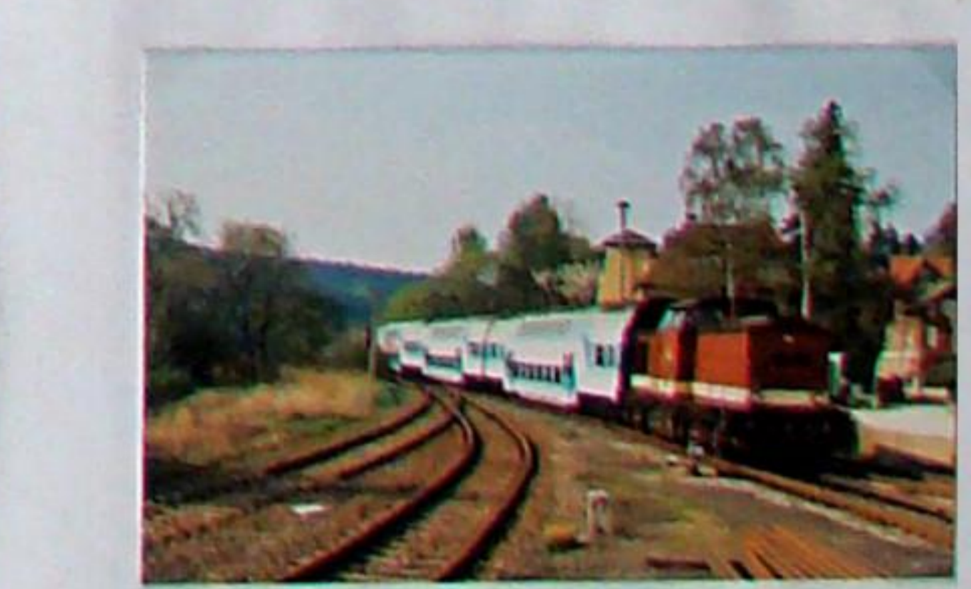
Anlässlich der Eröffnung des neuen Landratsamts-Gebäudes fuhr im Mai 1995 dieser Sonderzug nach Apolda.