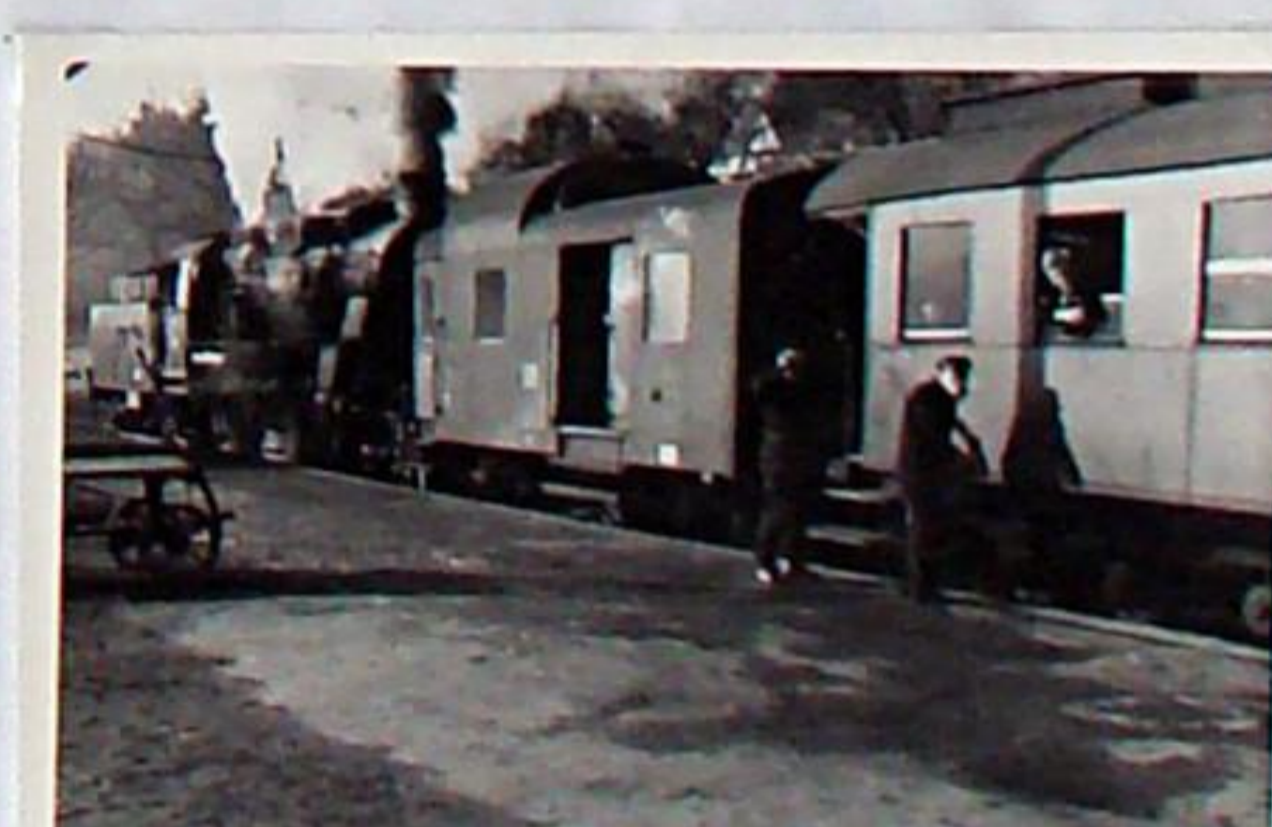
Personenzug nach Kranichfeld wartet am Bahnsteig 1 in Bad Berka auf die Ausfahrt - Anfang 1968