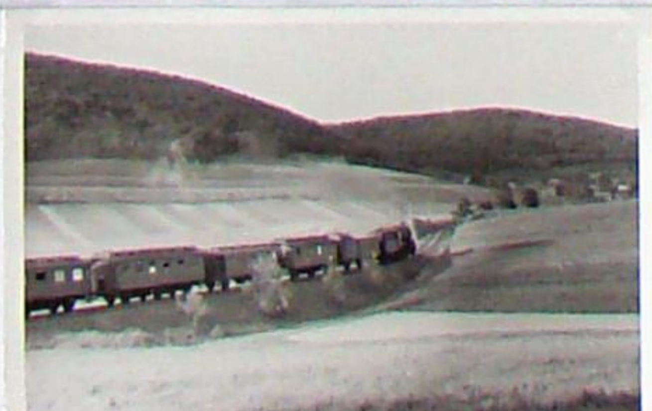
Im Schrägel vor Saalborn fährt am 29.5.1955 ein Personenzug nach Blankenhain