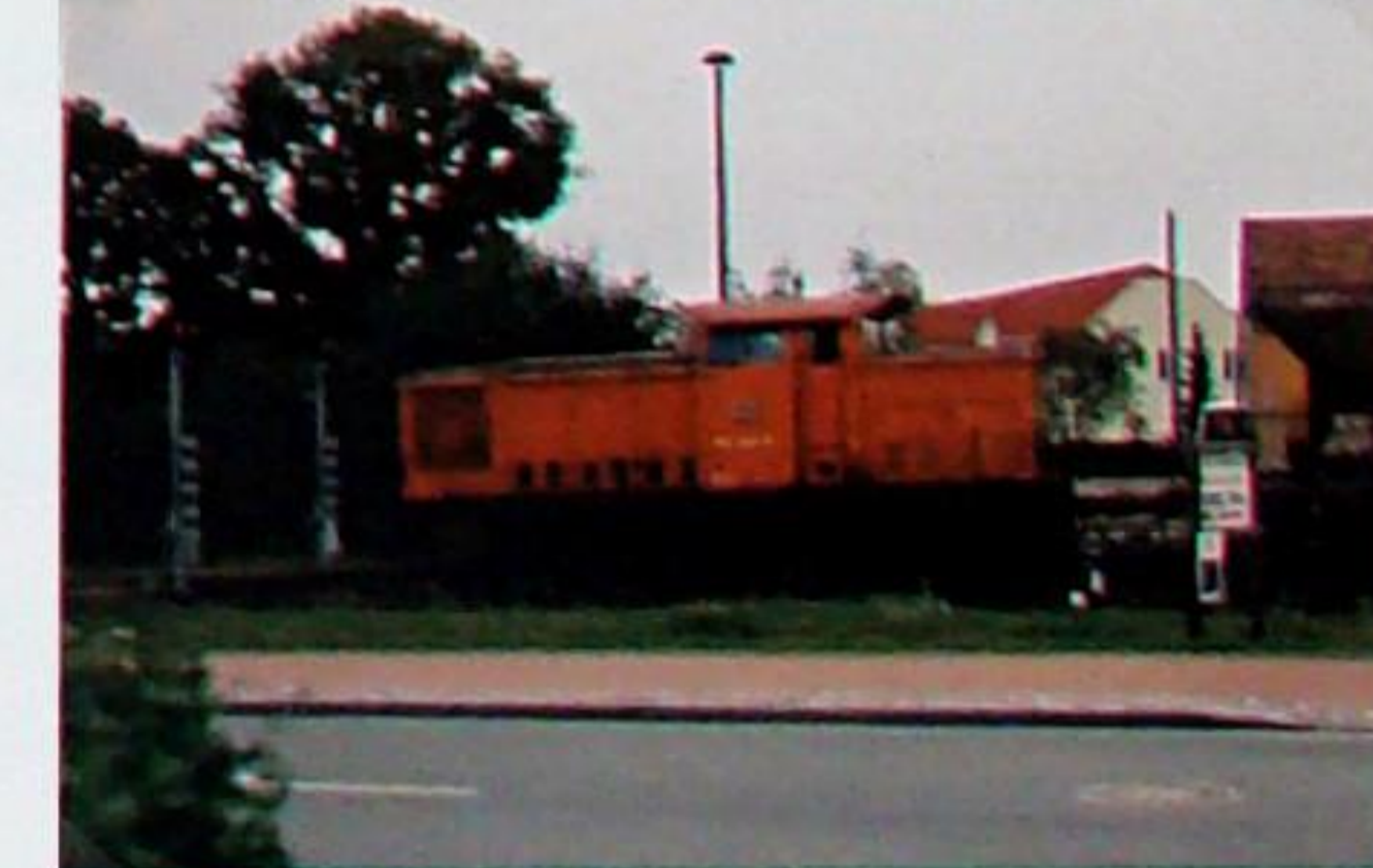
346 544-0 der DBAG, ehem. 106 544 zu Bauzugdiensten in Bad Berka am 25.8.1996