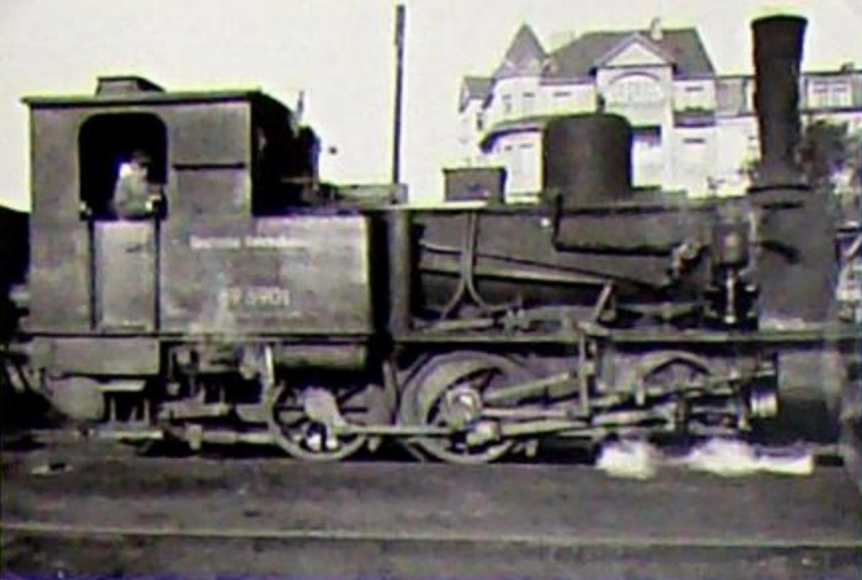
Die Lok 340 der Süddeutschen Eisenbahngesellschaft Darmstadt (SEG) stammte von der Arnstadt-Ichtershäuser Eisenbahn und kam als 89 5901 zur DR. Hier steht die C-Nassdampflok um 1950 vor der Hauptwerkstatt im Berkaer Bahnhof in Weimar. Henschel 6841/1904