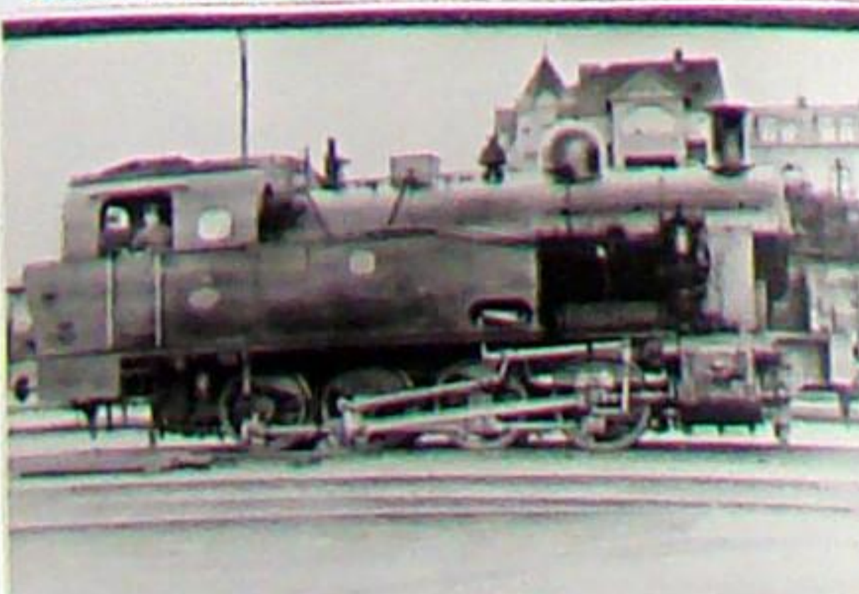
Lok 92 der Theag wurde 1922 gebaut und kam mit der Lok 91 über die Mecklenburgische Friedrich-Wilhelm-Eisenbahn im Jahr 1925 zur Strecke Weimar – Bad Berka – Kranichfeld und Blankenhain. Durch den Umbau auf Heißdampfbetrieb waren beide lange Zeit die stärksten auf der Strecke. Hier steht Lok 92 in den frühen 1930er Jahren in Weimar, Berkaer Bahnhof (DR 92 6579). Henschel 19036/1922