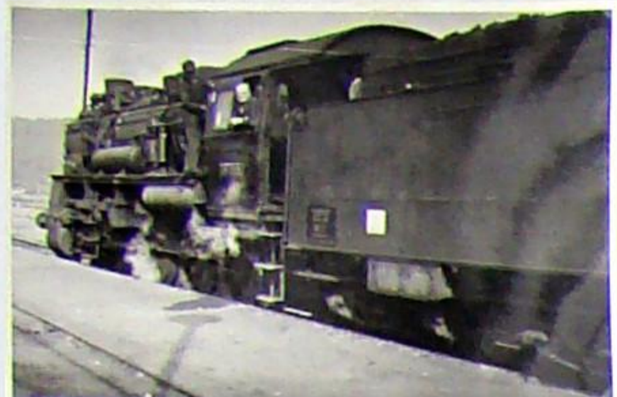
58 1075 des Bahnbetriebswerkes Weimar im Jahr 1967 in Kranichfeld. Hier sieht man einen Drehgestellender 2'2'T 21,5 pr, den einige 58er wegen der besseren Laufeigenschaften nach 1959 angebaute bekamen.