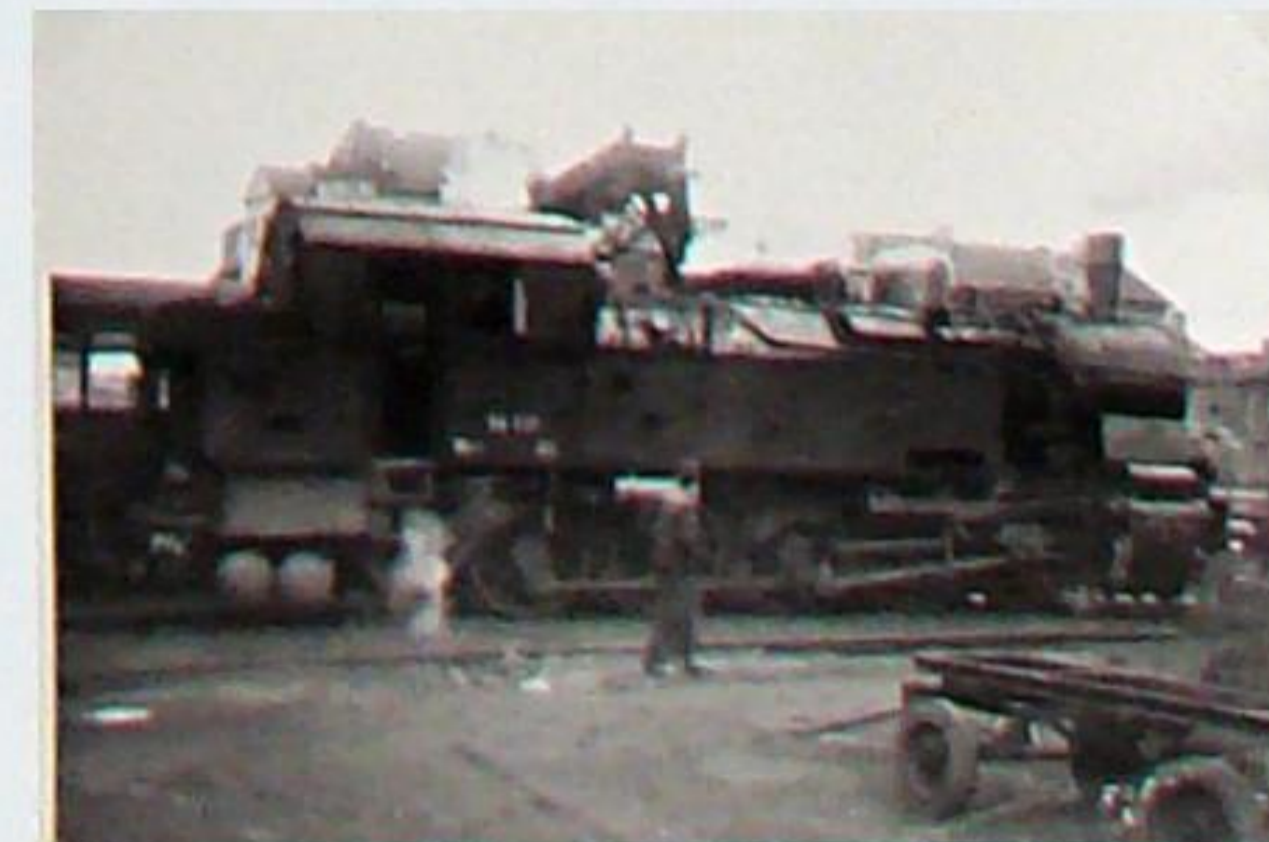
Die Reichsbahn-Tenderlok 94 717 gehörte ursprünglich zur preuß. Gattung T 16.1 und steht hier 1950 vor der ehem. Hauptwerkstatt in Weimar. Schwartzkopf 5775/1916