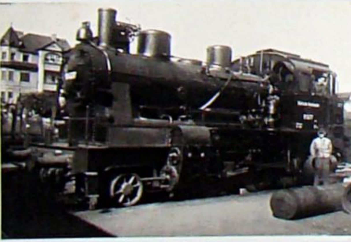
Die 1'Ch2i-Reichsbahnlok 91 6277 wurde 1925 für die Mühlhausen-Ebelebener-Eisenbahn gebaut und trug dort die Nr. 141. Sie gehörte um 1951 zum Bw Gotha und steht hier vor der ehemaligen Hauptwerkstatt Weimar/Berkaer Bahnhof. Krauss 8337/1925