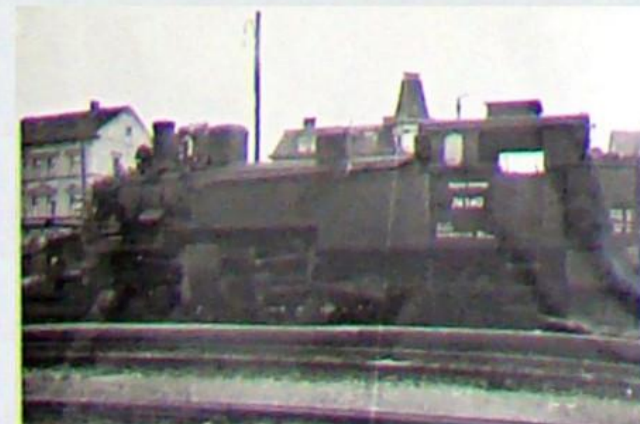
Vor dem Leichten Eilgüterzug (Leig) mit Stückgütern für die Bahnhöfe der Strecke war im Sommer 1953 die 74 140 – eine ehemals Preuß. T11-1'C Nassdampflok – im Bahnhof Weimar/Berkaer Bahnhof auf Ausfahrt.