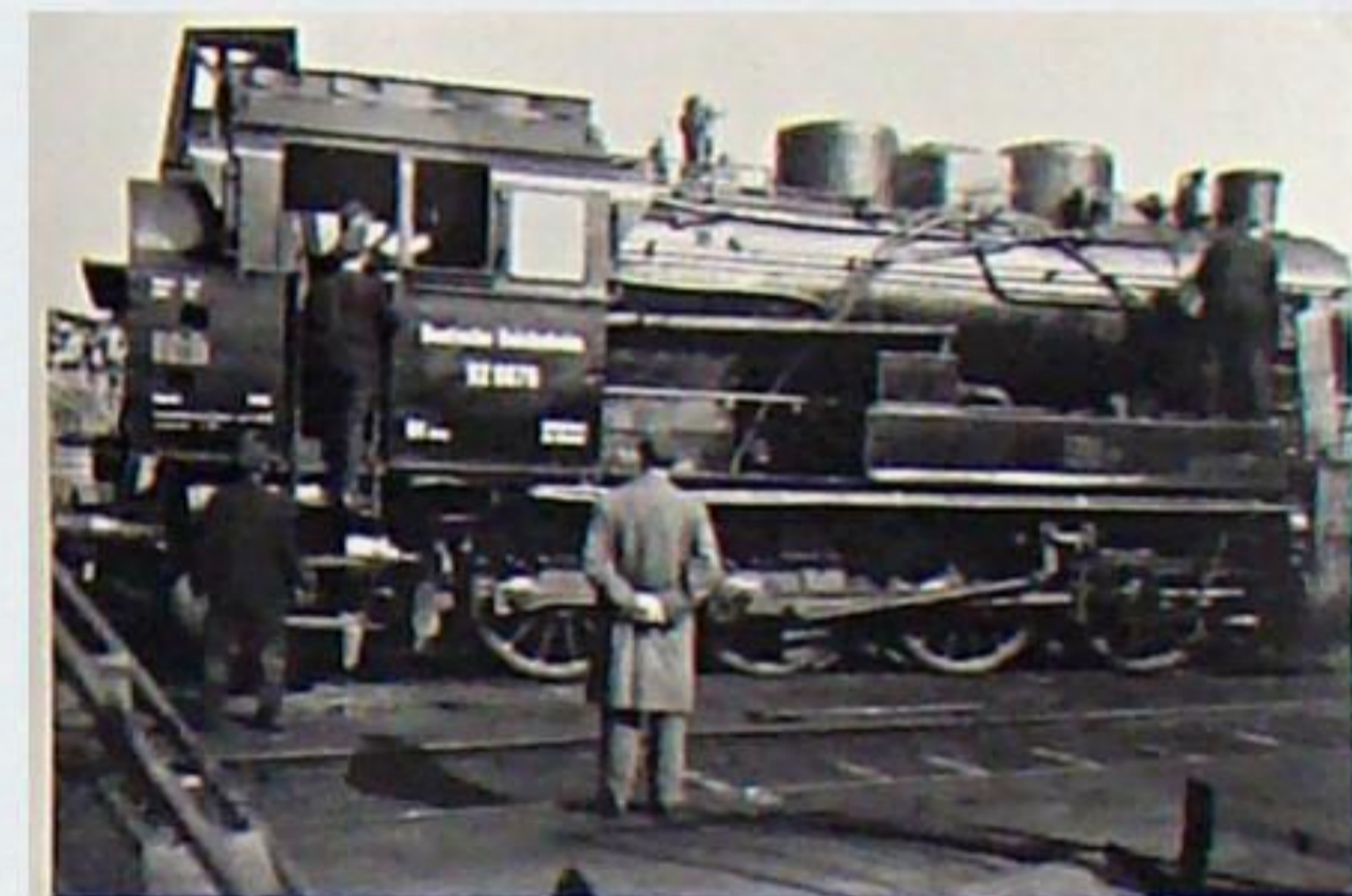
Die Rb-Lok 92 6876 gehörte zu einer Serie von insgesamt sechs Lokomotiven gleichen Typs, die für die Lübeck-Büchener-Eisenbahn gebaut worden waren. Für den Betrieb auf der Buchenwaldbahn kamen drei davon von der DR als 92 435 – 437 nach Weimar, um dort die Nummer 96 – 98 zu erhalten. 1946 dem Anlagevermögen der WBBIE zugeschrieben, steht die ehemalige Lok 96 hier im Jahr 1950 kurz vor dem Abschluss einer Kesseluntersuchung vor der Hauptwerkstatt Weimar – B. Linke-Hofmann 3175/1930