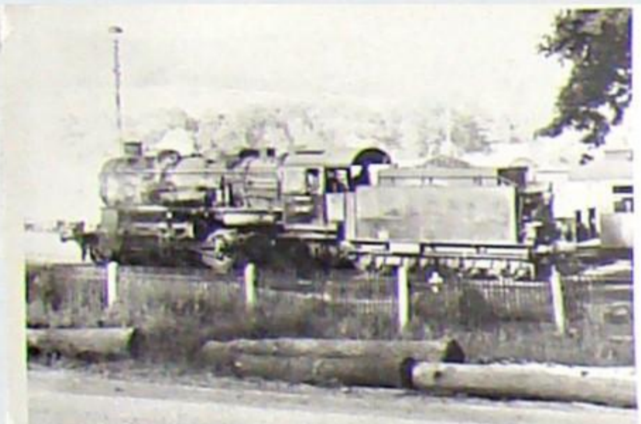
58 1087 war eine alte Stammlok der „Berk'schen Schiene“, die erst 1972 in Saalfeld ausgemustert wurde. Bad Berka im Sommer 1969