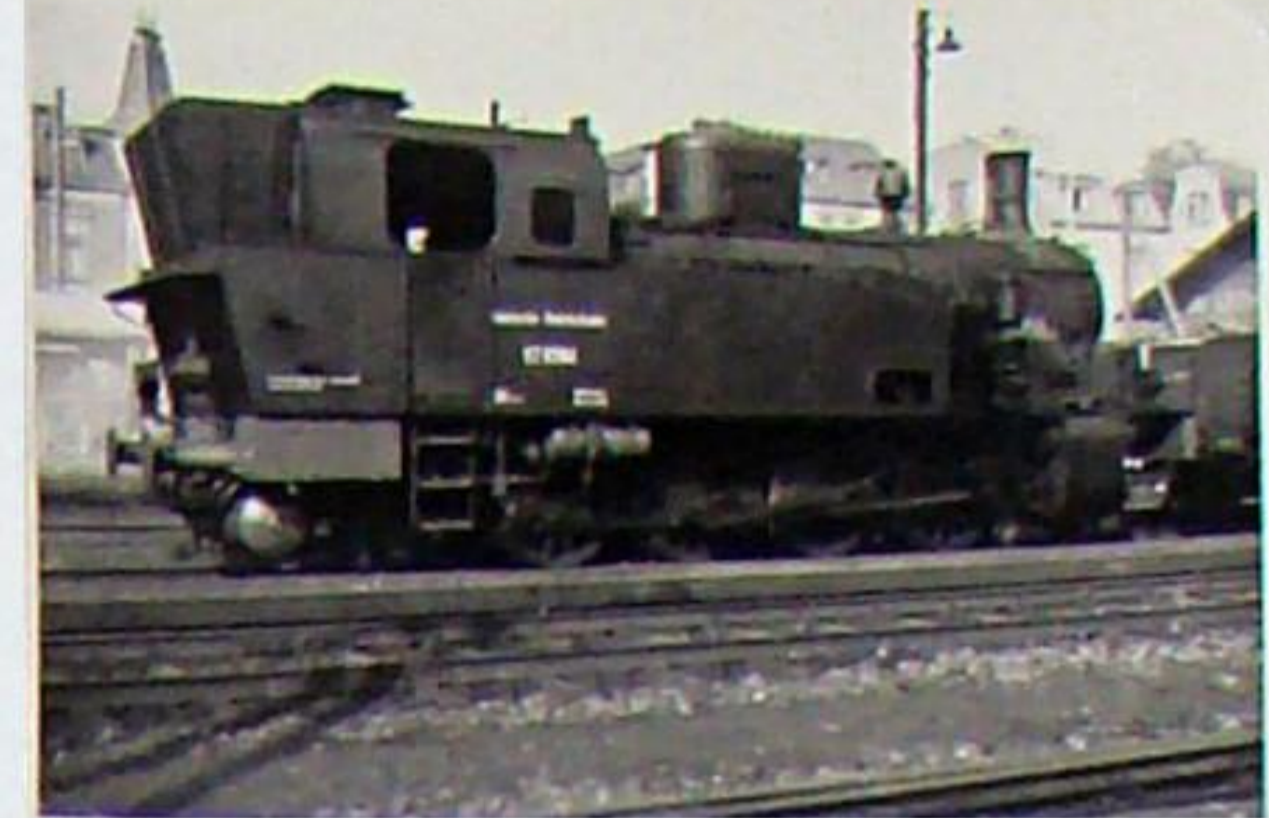
Die Rb-Lok 92 6584 wurde als Lok 385 für die SEG im Jahr 1927/28 gebaut und fuhr zuletzt auf der Ilmenau-Großbreitenbacher Eisenbahn. Zum Bw Arnstadt gehörig, steht sie hier (oben) 1950 auf dem Berkaer Bahnhof in Weimar Henschel 20871/1927