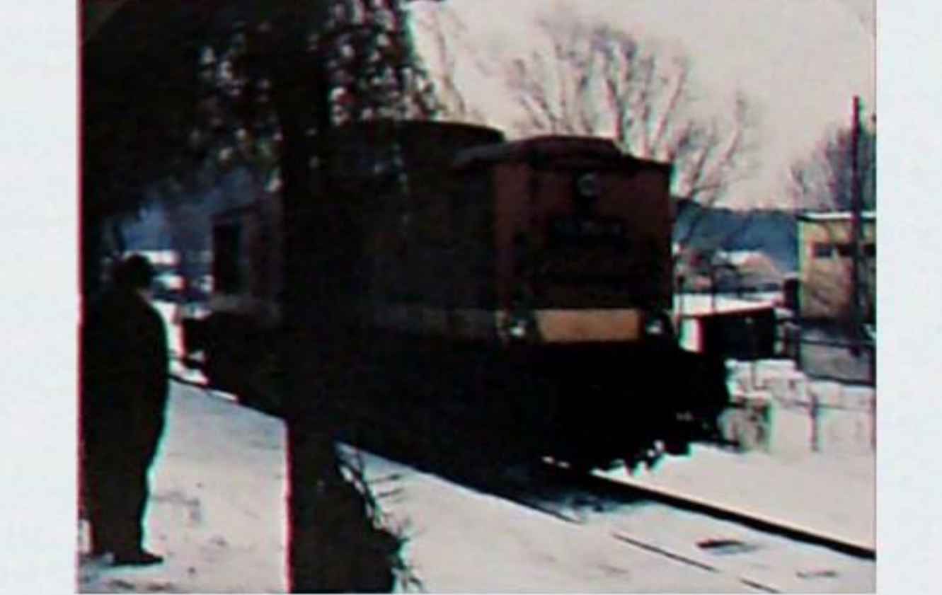
112 302-5, eine ehemalige Eisenacher Lok um 1992 in Kranichfeld LEW 12766/1970