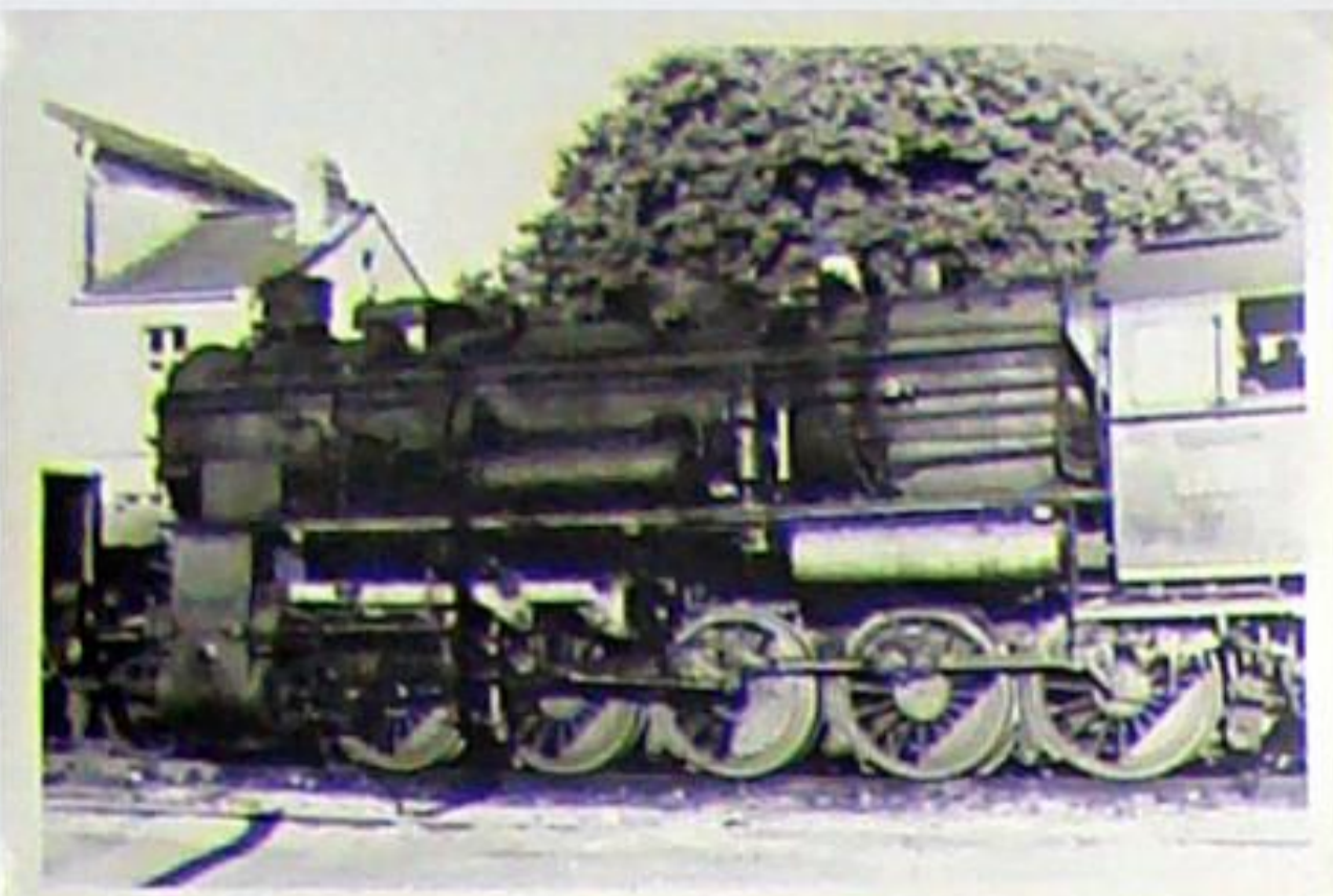
Güterzug-Schleppenderlok 58 1049 der Deutschen Reichsbahn im Bahnhof Bad Berka im Sommer 1969. An der unterschiedlichen Stellung der Gegengewichte an den Kuppelachsen erkennt man die Dreizylinderlok.