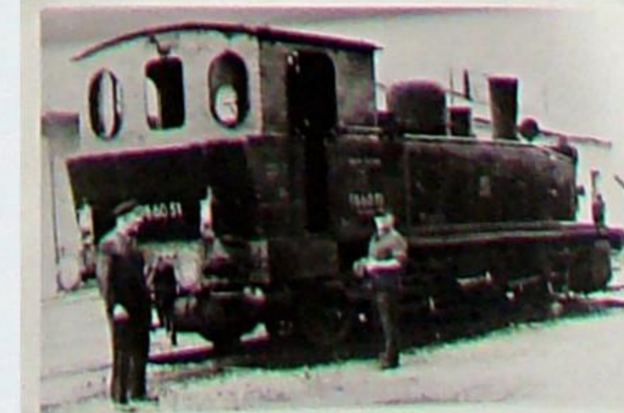
Von den sechs Bachstein-Mallet-Loks kamen nur noch drei zur DR in der DDR. Die älteste dieser W-B-Nassdampf-Verbund-Tenderloks war die ehem. Theag 82. Je zwei Hoch- und Niederdruckzylinder trieben die beiden hinteren festen Achsen und das vordere Drehgestell an (zweistufige Dampfdehnung). Hier steht 98 6051 (Theag 82 – Jung 472/1901) 1950 im Bw Weimar.