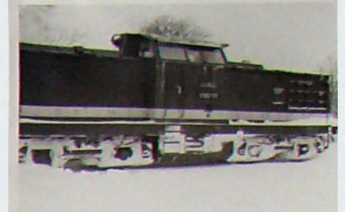
Die dritte Diesellok war V 100 171, die im Januar 1970 ihre ersten Dienste versah, hier beim Schnee-Einbruch März 1970. LEW 12 452/1969. Zusammen mit der V 100 002 (eigentlich V 100 173 – LEW 12404/1969) kamen diese drei 1978/79 nach Saalfeld.