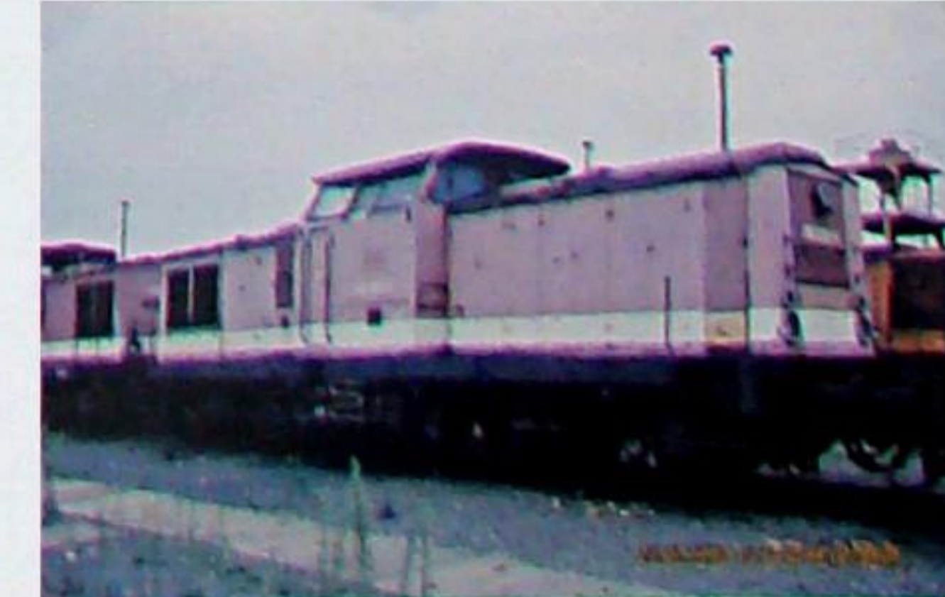
So sah die langjährige, immer gut geputzte Berksche Stammlok 202 232-5 (112 292-8 - V 100 292 – LEW 12756/1970) am 23.07.1997 in Gera aus! Ob es diese Lok noch gibt?