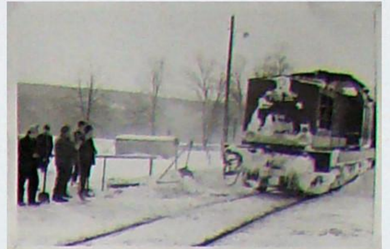
Die erste Streckendiesellok auf der Berk'schen Schiene war V 100 144. Sie gehörte zur ersten Bauserie, also mit Streckengang und Rangiergang (Stufengetriebe). Im August 1969 fanden die ersten Einsätze statt. Im März 1970 gab es einen starken Wintereinbruch mit Schneeverwehungen und Störungen im Eisenbahnbetrieb – hier in Bad Berka. Lokomotivbau-Elektrotechnische Werke Hennigsdorf bei Berlin ehem. AEG 12445/1969