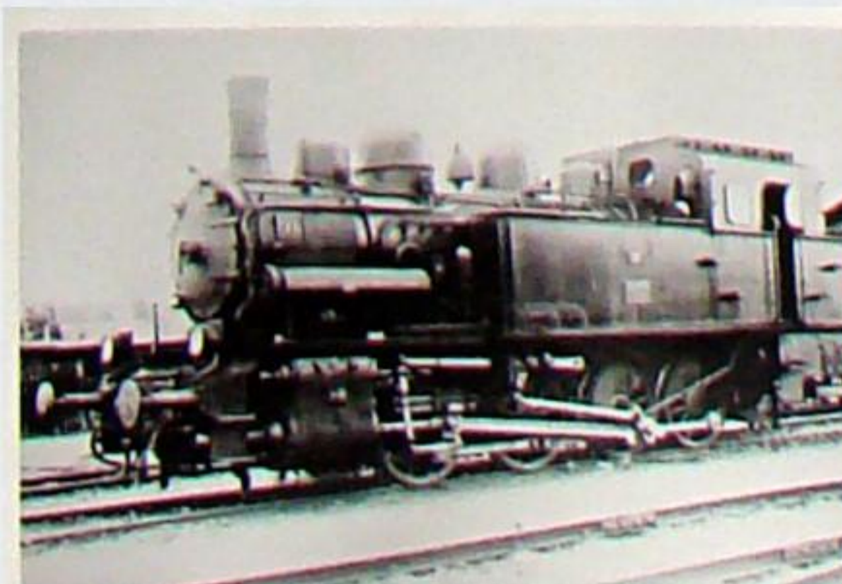
Die Theag-Lok Nr. 91 war die erste von drei fast baugleichen Dh2-Tenderloks, die neu für die WBBIE gebaut wurden. Sie unterschied sich von den beiden Nachfolgern Nr. 94 und 95 durch geringeren Kesseldruck, kleineren Überhitzer, etwas kürzeren Rahmen, durch ursprünglich Petroleumlampen, seitlich liegenden Vorwärmer für das Kesselspeisewasser und Ramsbottom-Sicherheitsventile. Hier steht sie – schon mit elektrischer Beleuchtung – im Weimar/Berkaer Bahnhof. Als 92 6480 fuhr sie bei der DR. Orenstein und Koppel 10994/1925