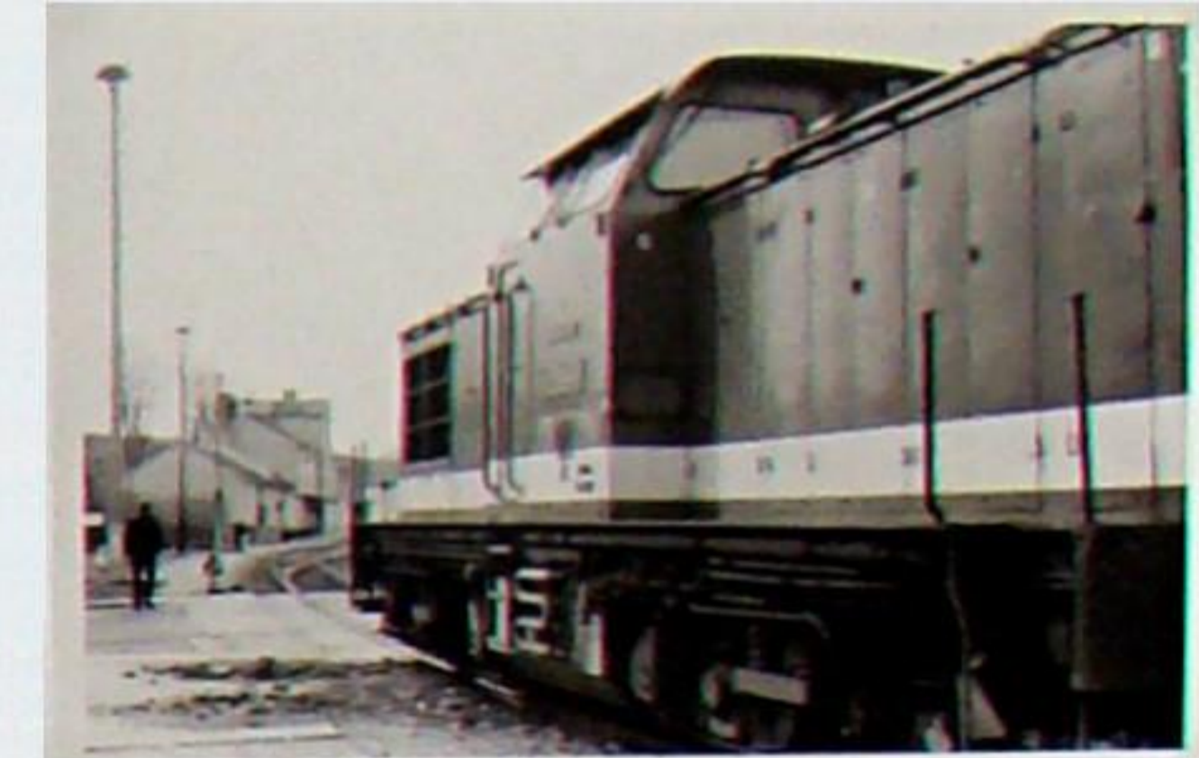
112 559-0 in Bad Berka vor dem Umsetzen in Gleis 1 im Jahr 1987. LEW 13877/1973