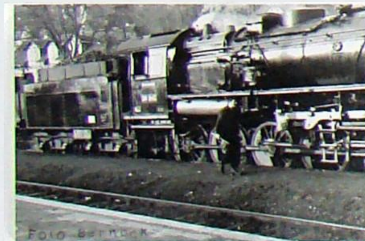
Teilansicht der Lok 58 1143 mit einem Drehgestellender der preuß. Bauart 2'2' T 20 mit genieteten Blechrahmen-Drehgestellen am Anfang des Jahres 1968 in Bad Berka, als das Bw Weimar schon als Betriebsteil 3 zum Bw Erfurt gehörte.