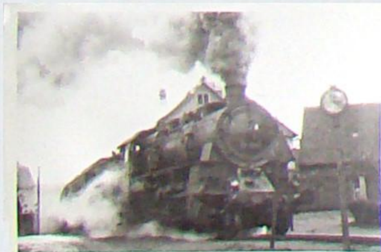
1957 fährt 58 1385 mit einem Personenzug am Zeughaus Bad Berka vorbei in Richtung Weimar