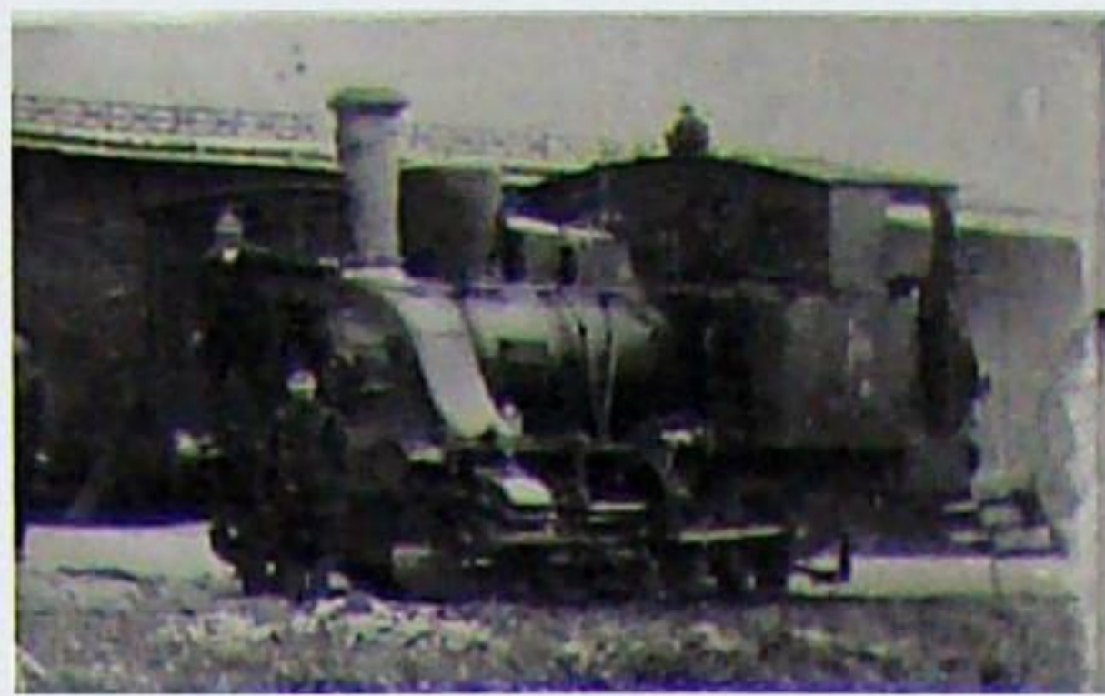
Wenn die alte Lok „Berka“, später Nr.4 und dann Nr. 73, noch 1949 zur DR gekommen wäre, hätte man sie in die Baureihe 89 einordnen müssen. Hersteller Krauss in München Fabr.-Nr. 1646, Baujahr 1886. Diese kleine Tenderlok steht hier im Jahr 1906 vor dem Güterschuppen in Kranichfeld.