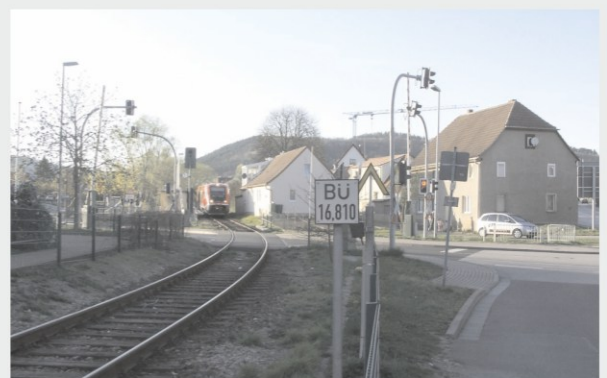
Um 1920 glich der Bahnübergang am Zeughaus noch eher einem Trampelpfad, noch keine Spur von Schranke und Bahnsteig und der Blick zur Hexenbergsschule war noch nicht durchs Gewerbegebiet verdeckt, wie dann 2007 im Vergleich. Postkarte Verlag H.Rubin Dresden-Blasewitz, Sammlung Matthias Geist, Foto: Matthias Geist