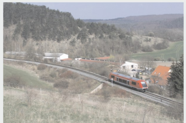
Etwa 15 Jahre liegen zwischen diesen beiden Aufnahmen von 1992 und 2007, die Triebwagen sind immer noch rot, aber aus dem Kuhstall ist ein Pferdestall geworden.