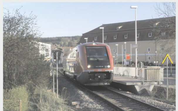
Im Januar 1998 konnte man vom neuen Haltepunkt noch nichts erkennen, das Zeughaus wurde gerade umgebaut und an dem Haus direkt an der Bahn war der Anbau noch nicht erkennbar. Zum Vergleich wieder das Jahr 2007.