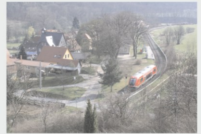
Dieser schöne Blick ins Ilmtal von einem Hügel oberhalb Hetschburgs entstand 1940, 1983 an einem Zwiebelmarktweekende, an dem die Züge verstärkt wurden und am Ostermontag 2007, als in diesen Zug bei schönstem Wetter allein in Hetschburg mehr als 15 Fahrgäste einstiegen.