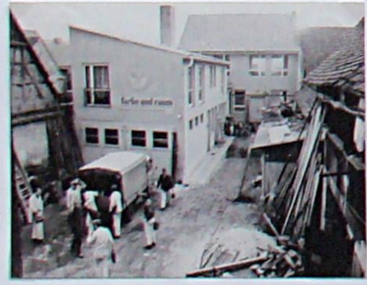
Errichtung der neuen Werkstatt 1967 - 1968