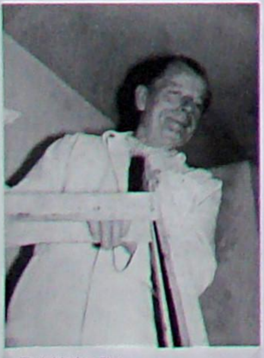
Ein kritischer Blick