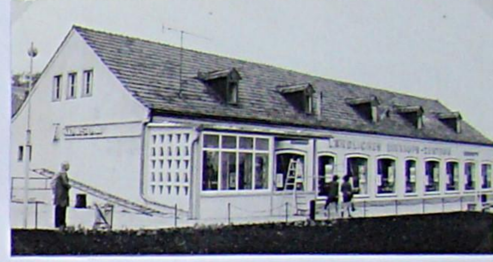
Stätten des Wirkens: Einkaufs-Zentrum Berstedt 1982 und Kulturhaus Berstedt 1979 rechts