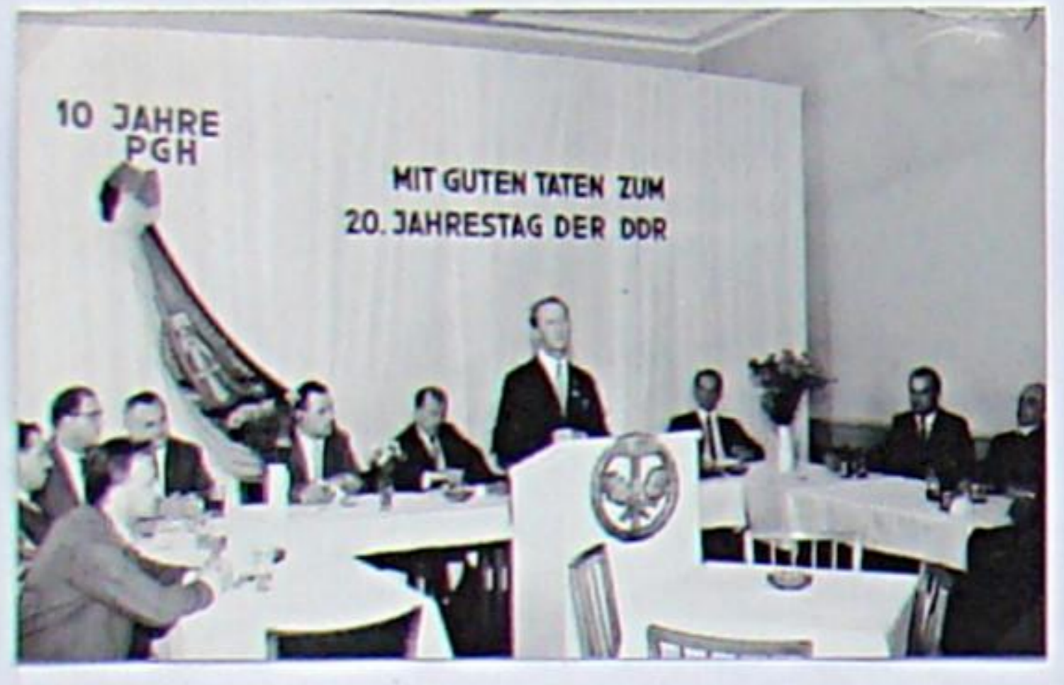
Feier zum 10jährigen Bestehen der PGH Farbe und Raum 1968