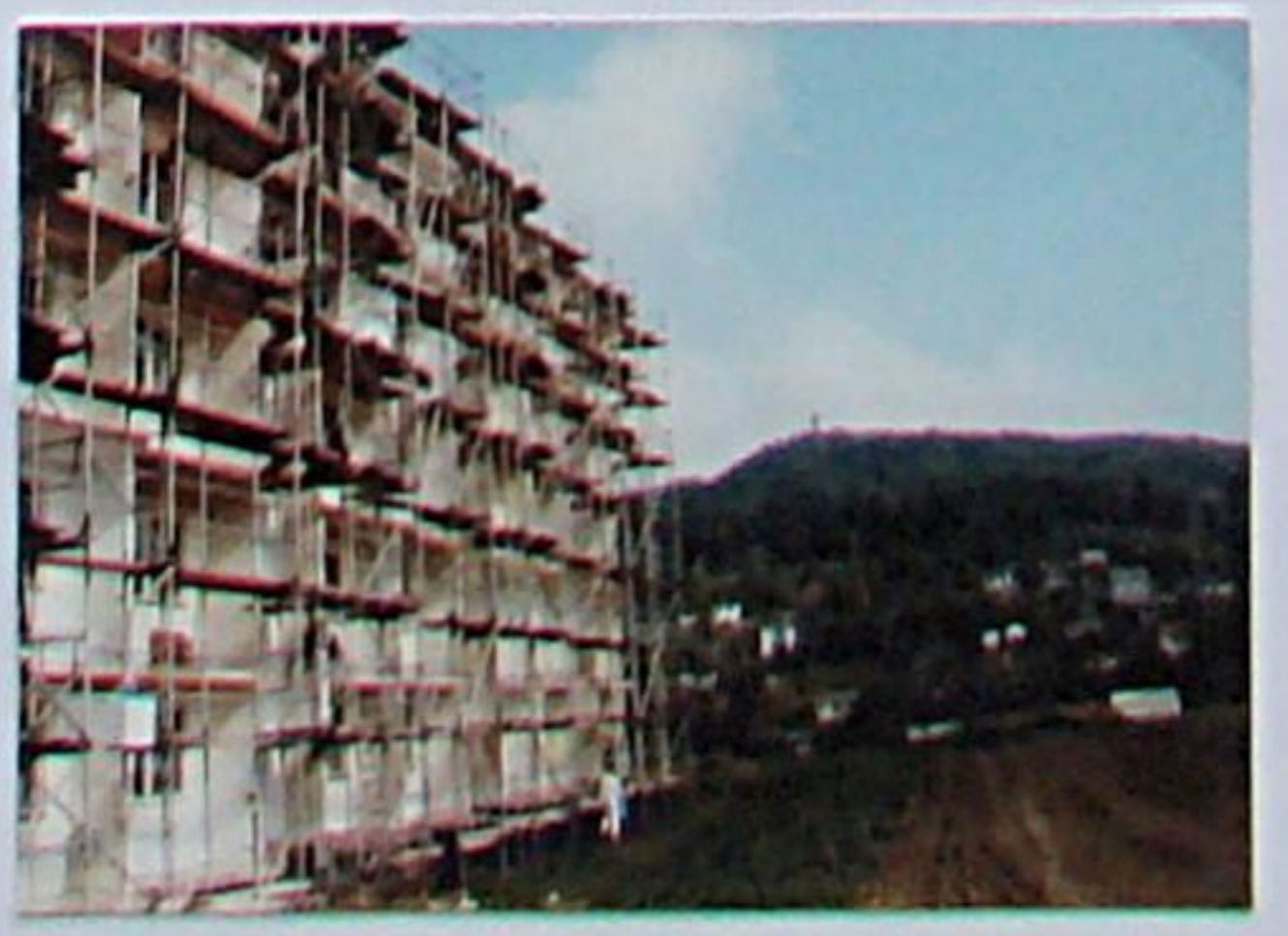
Fassadengestaltung in der Solesmeser Straße - um 1995