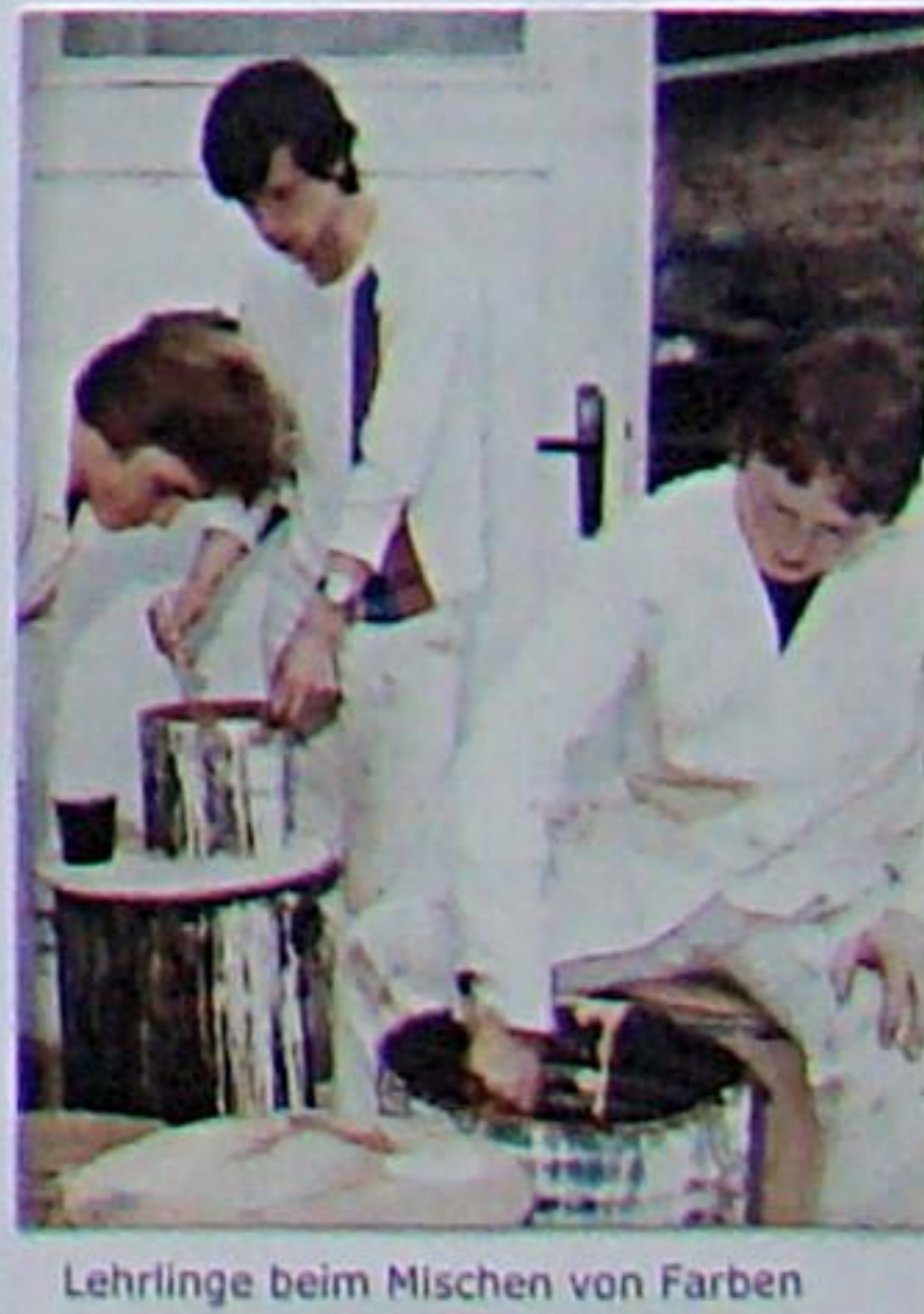
Lehrlinge beim Mischen von Farben