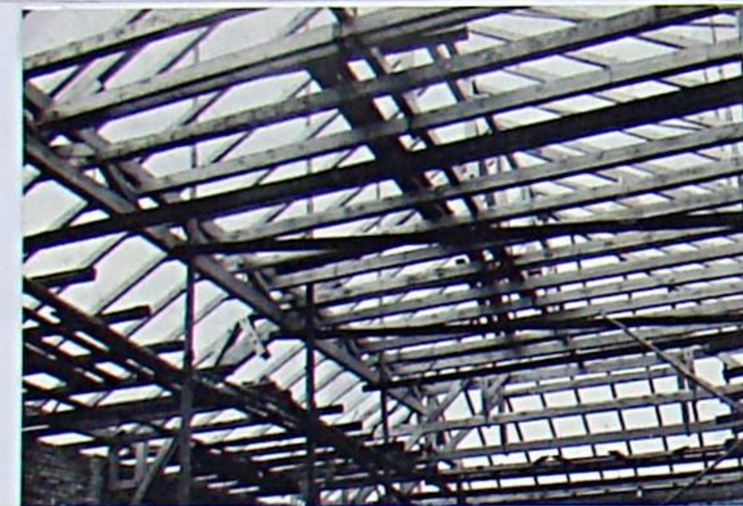
Dachkonstruktion am Stadgartensaal