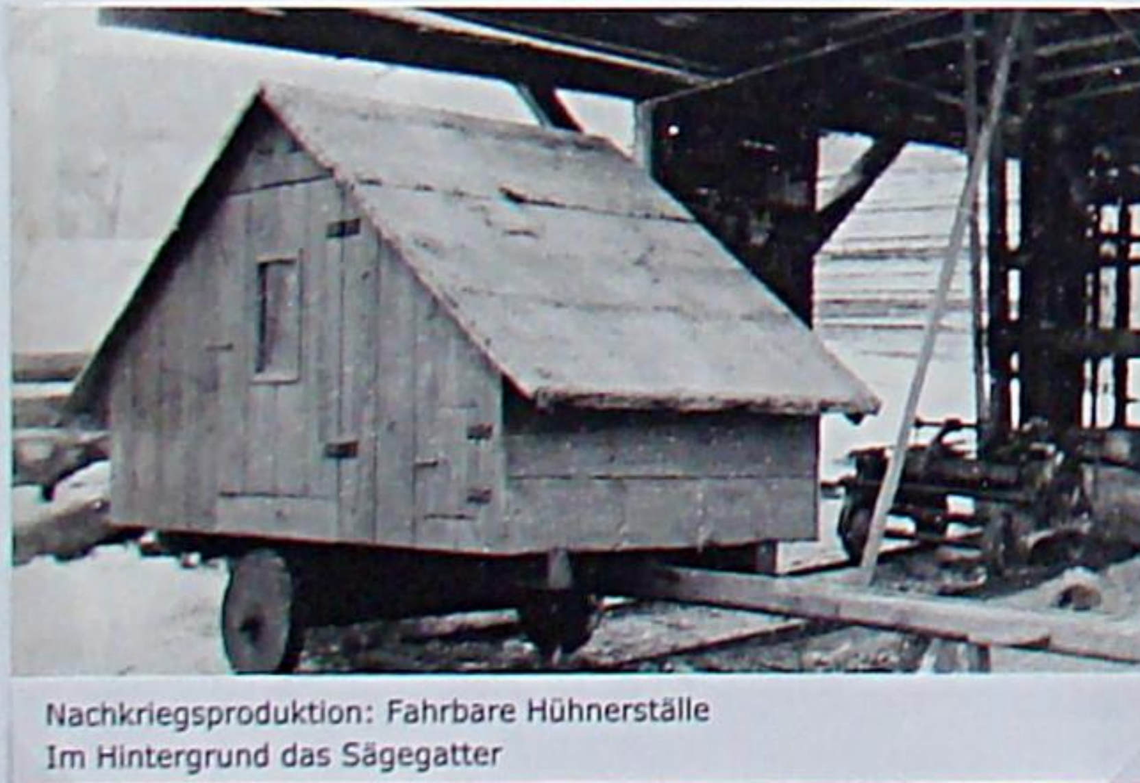
Nachkriegsproduktion: Fahrbare Hühnerställe Im Hintergrund das Sägegatter