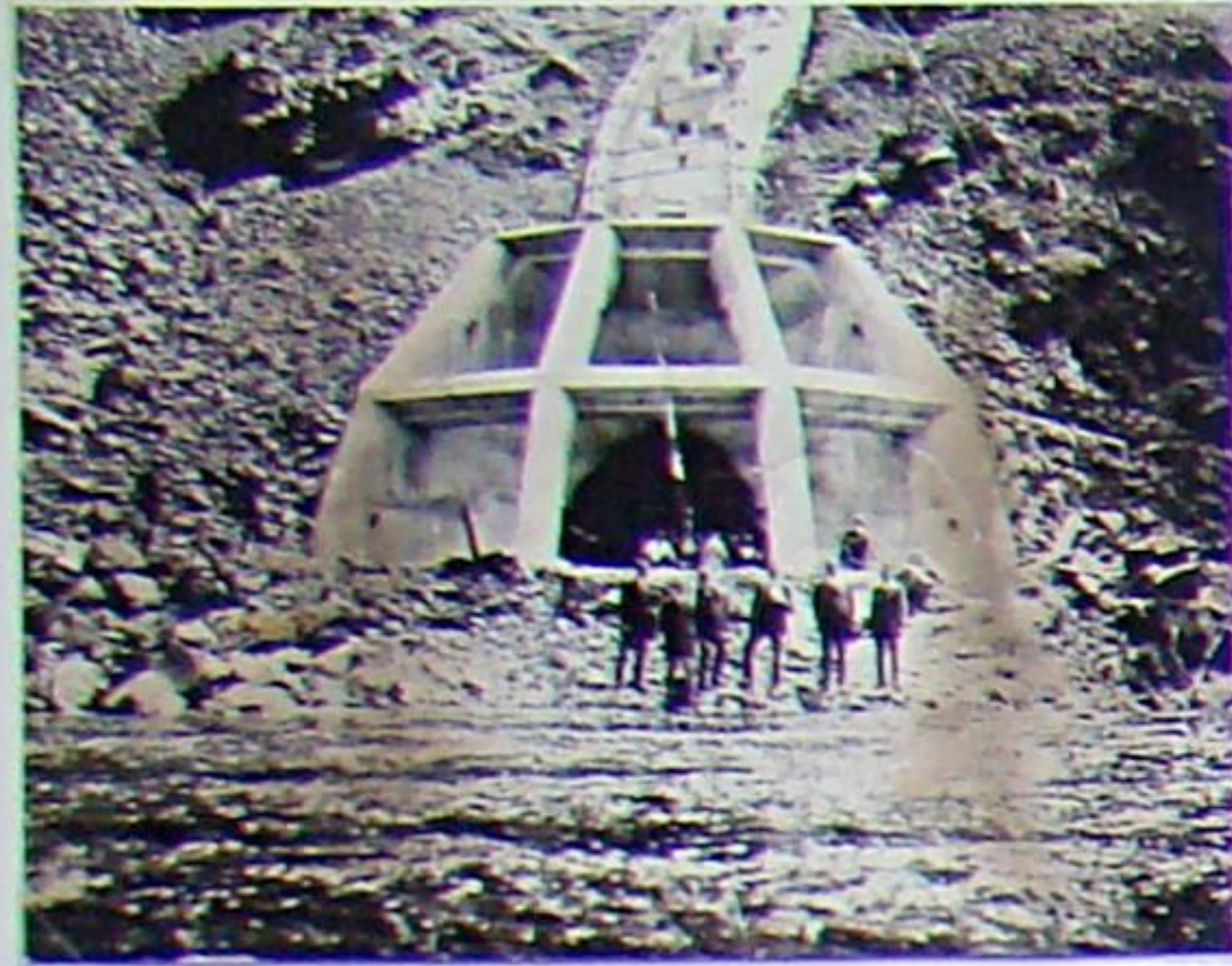
Bau von Riesenrechen an der Bleilochtsperre in den 1920er Jahren