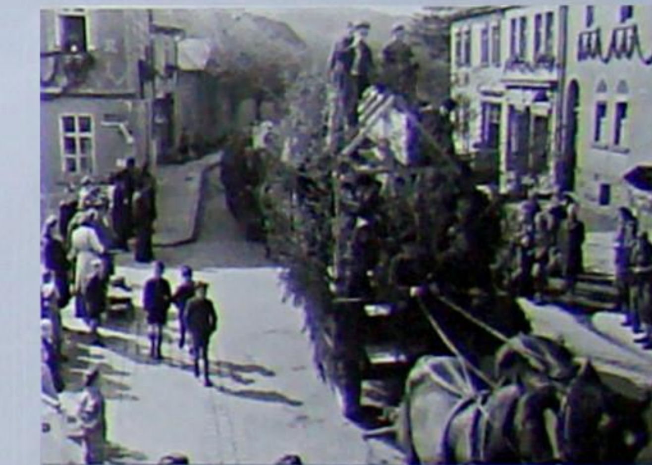
Festwagen der Fa. Geßner bei den Demonstrationen zum 1. Mai 1949 und 1950