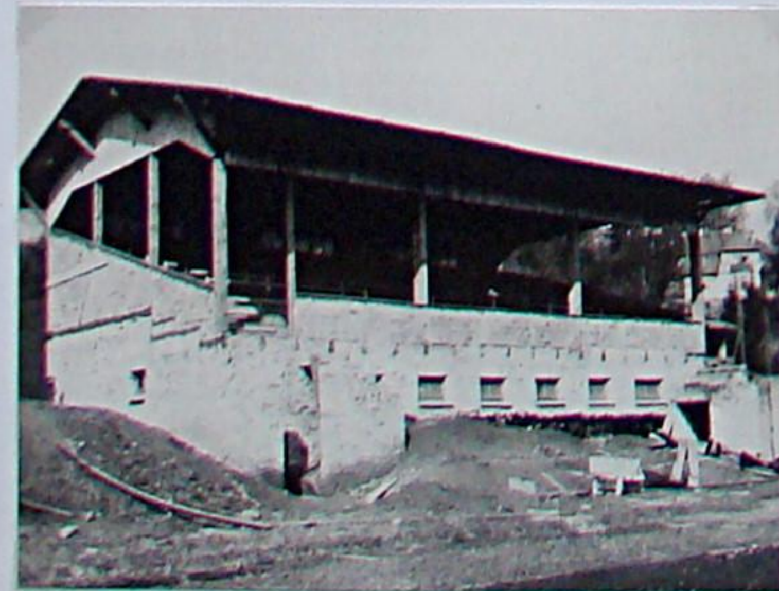
Errichtung der Zuschauertribüne am Sportplatz durch die Firma Geßner Mitte der 50er Jahre. Ein Teil der Arbeiten wurde im Nationalen Aufbauwerk geleistet.