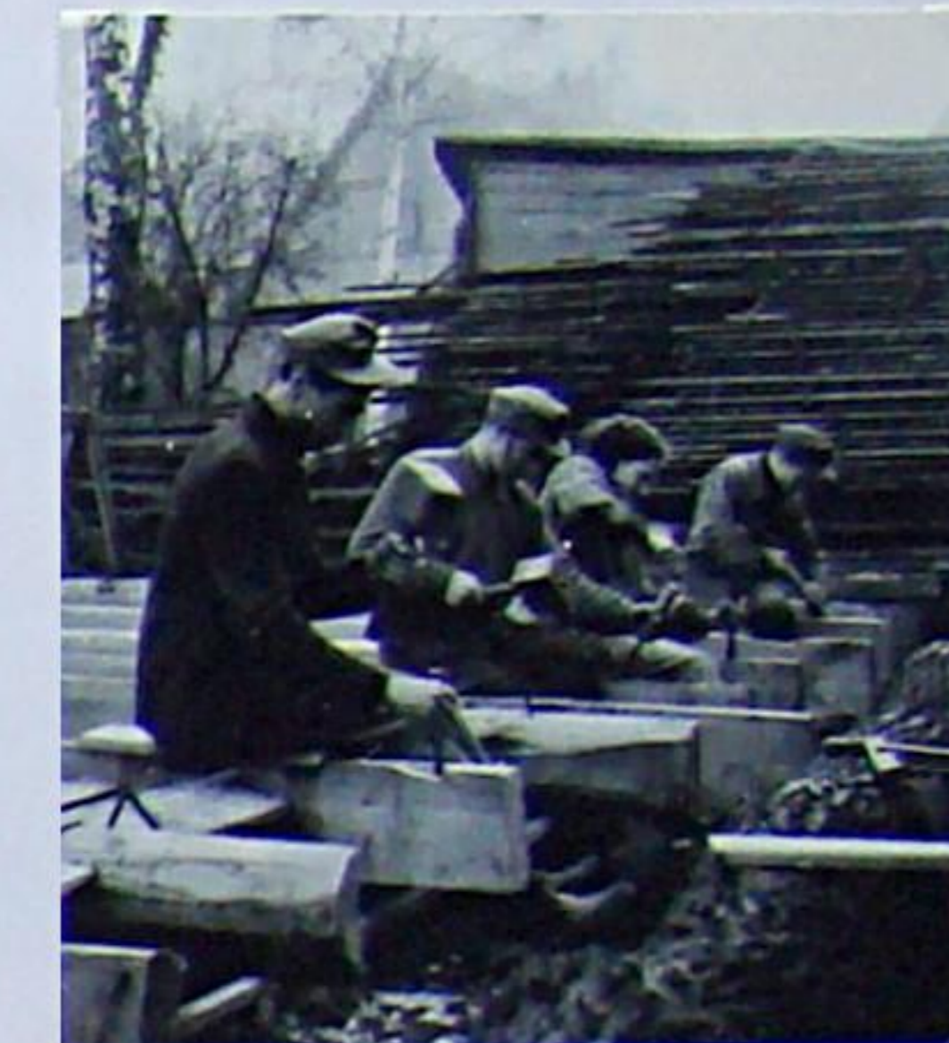
Zimmerleute an einer Balkenlage um 1955