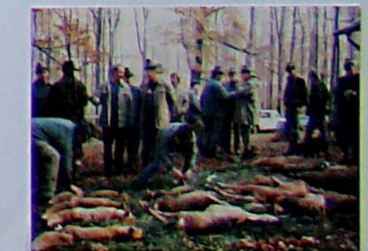
Bejagt werden im Forstamt Bad Berka Reh-, Dam-, Muffel- und Schwarzwild. Jährlich werden rund 600 Stück Schalenwild erlegt.