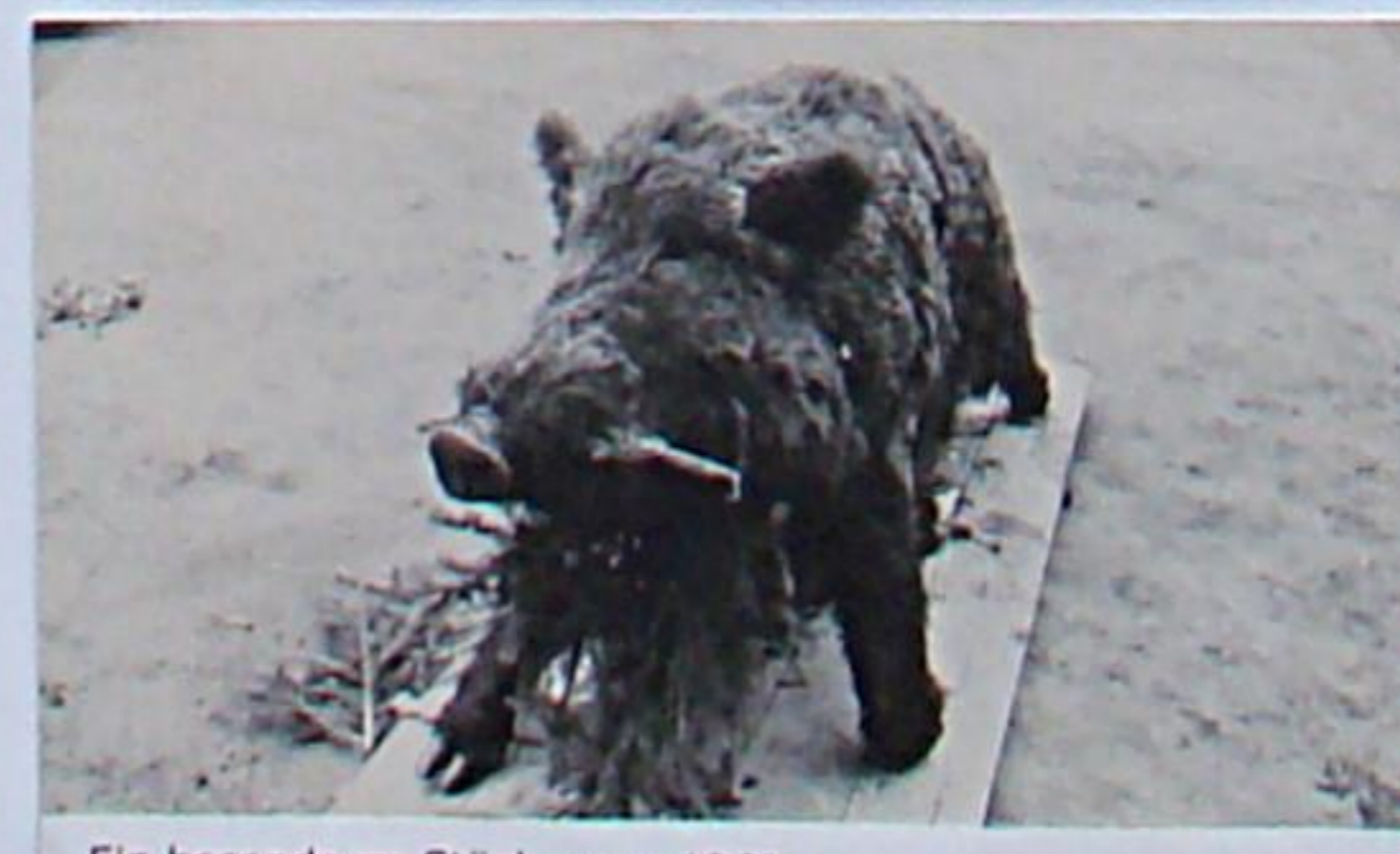
Ein besonderes Stück - um 1960