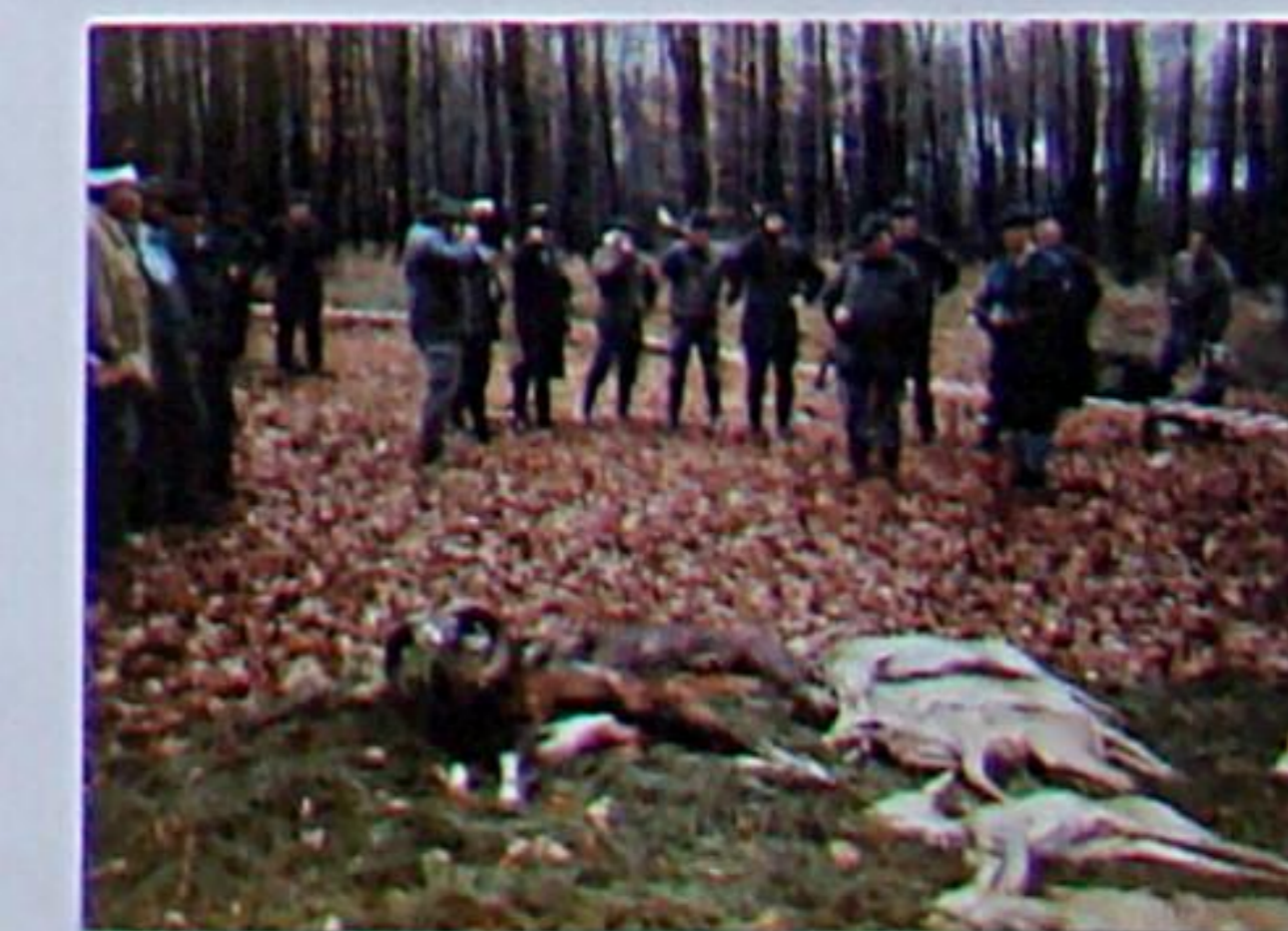
„Verblasen der Strecke“ - ein erfolgreicher Jagdtag geht zu Ende