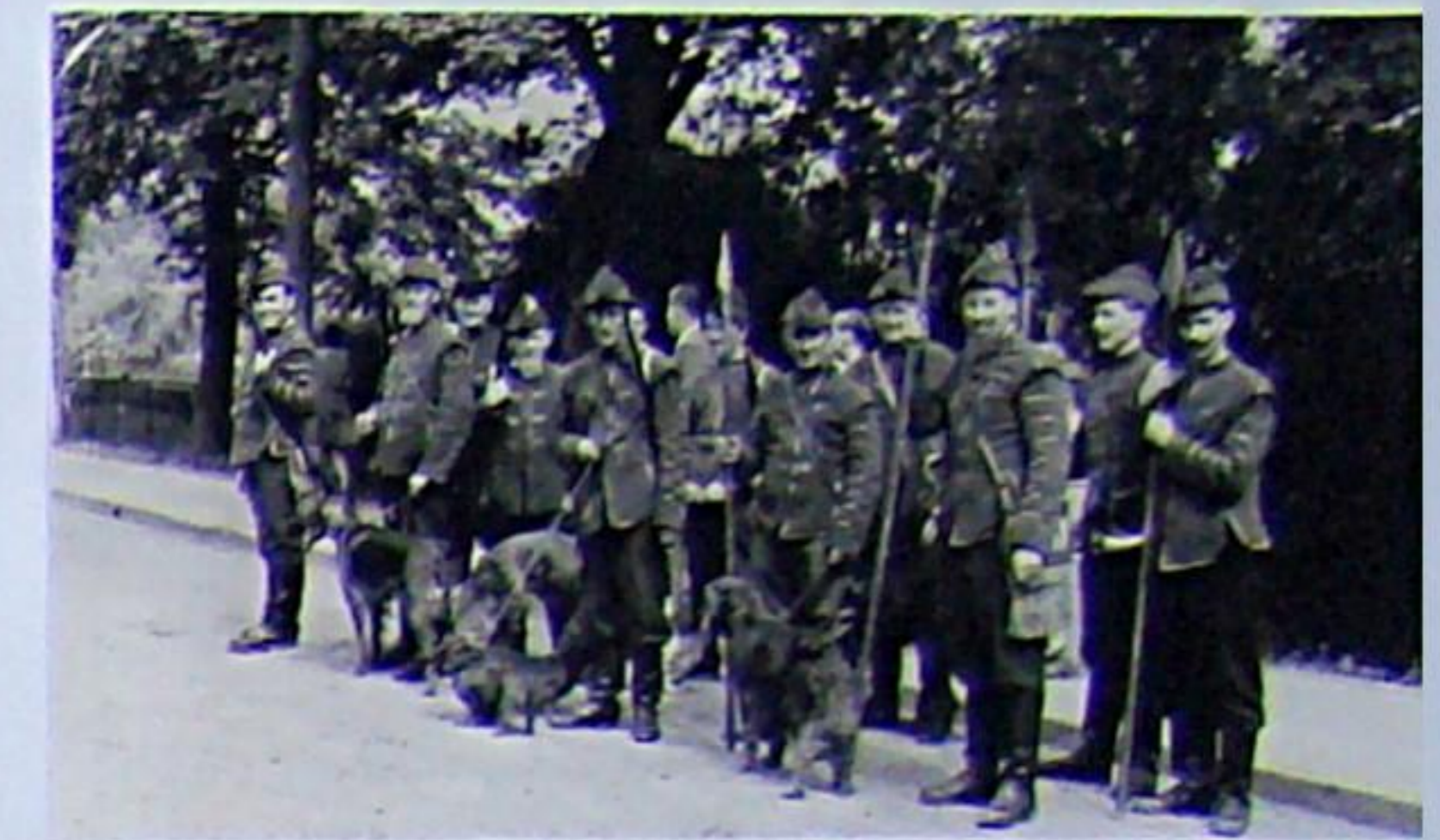
Historisches Jagdbild zum Brunnenfest in den 1950er Jahren, gestaltet von Jägern, Förstern und Forstarbeitern