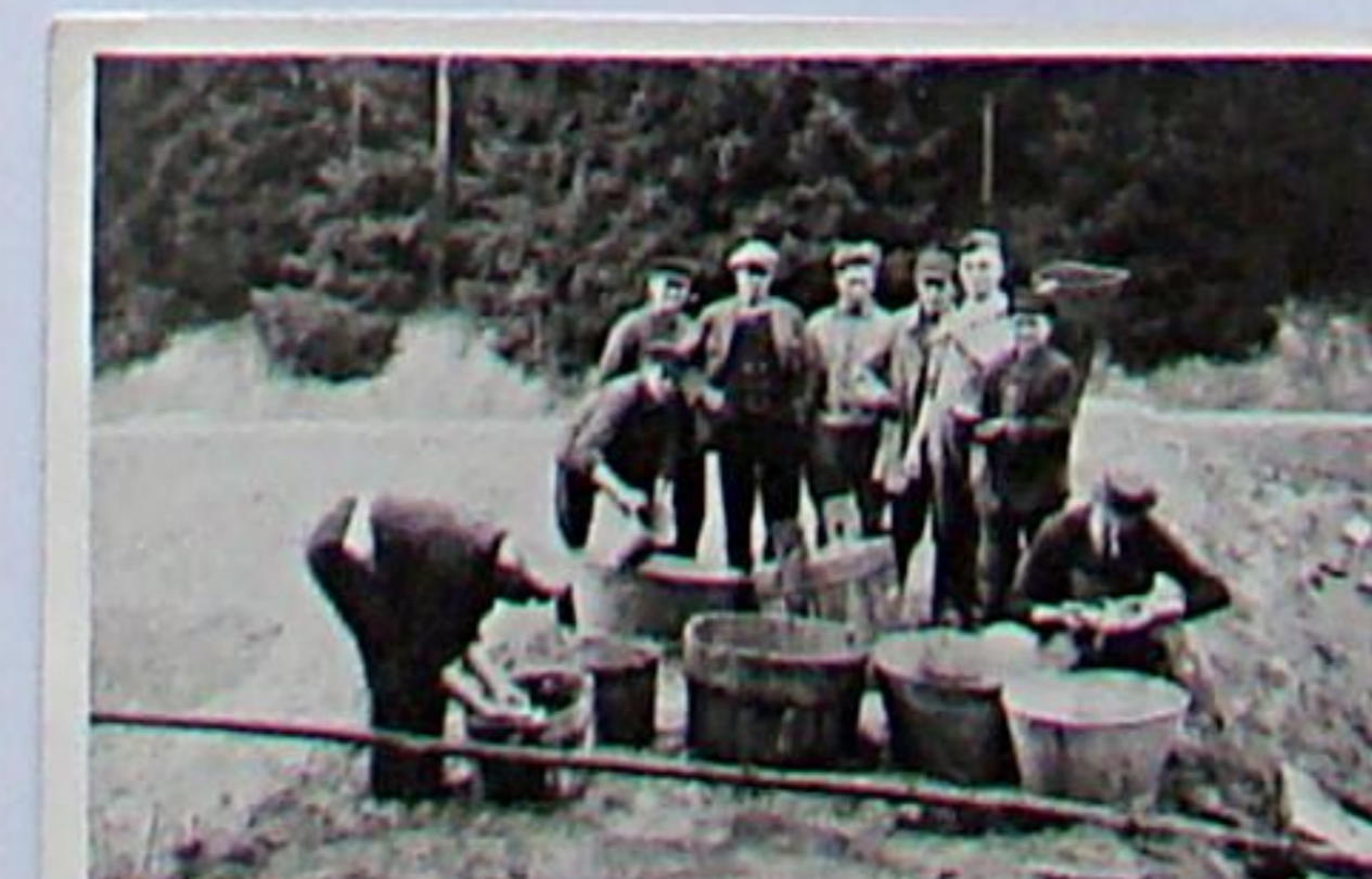
Abfischen in den Dreiteichen um 1930