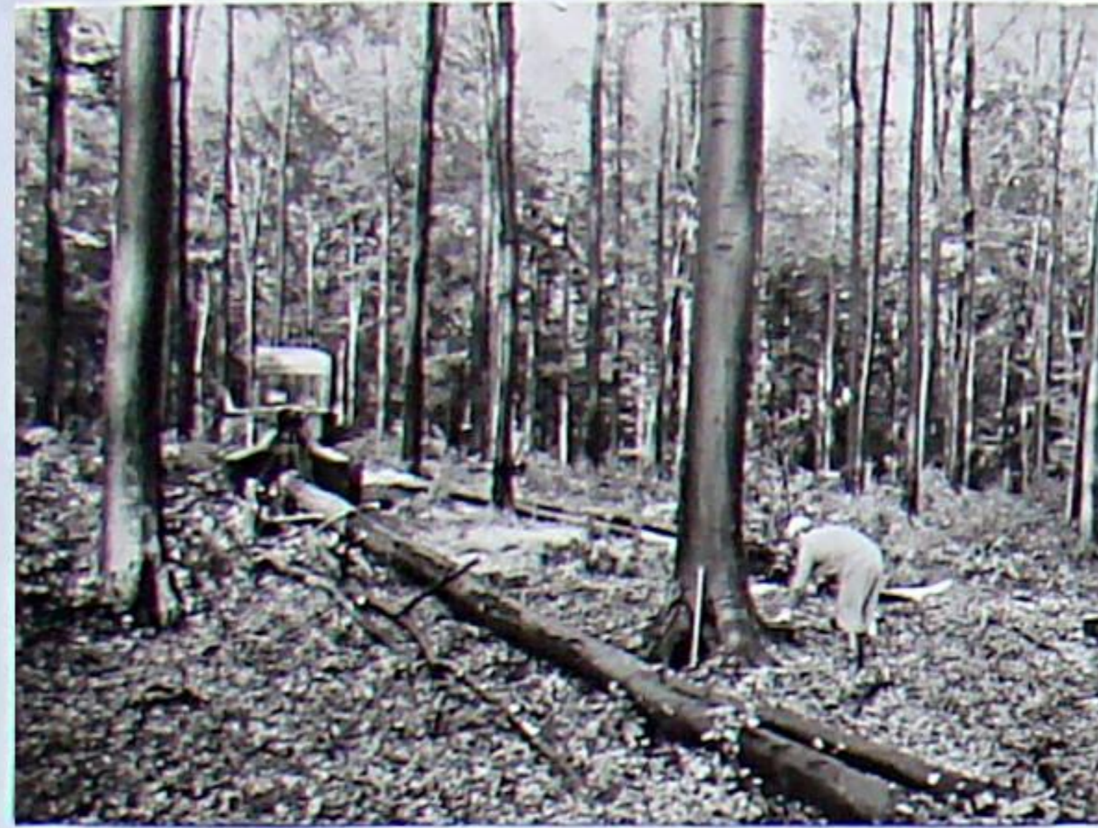
Holzrücken und Schleppen auf dem Adelsberg 1985