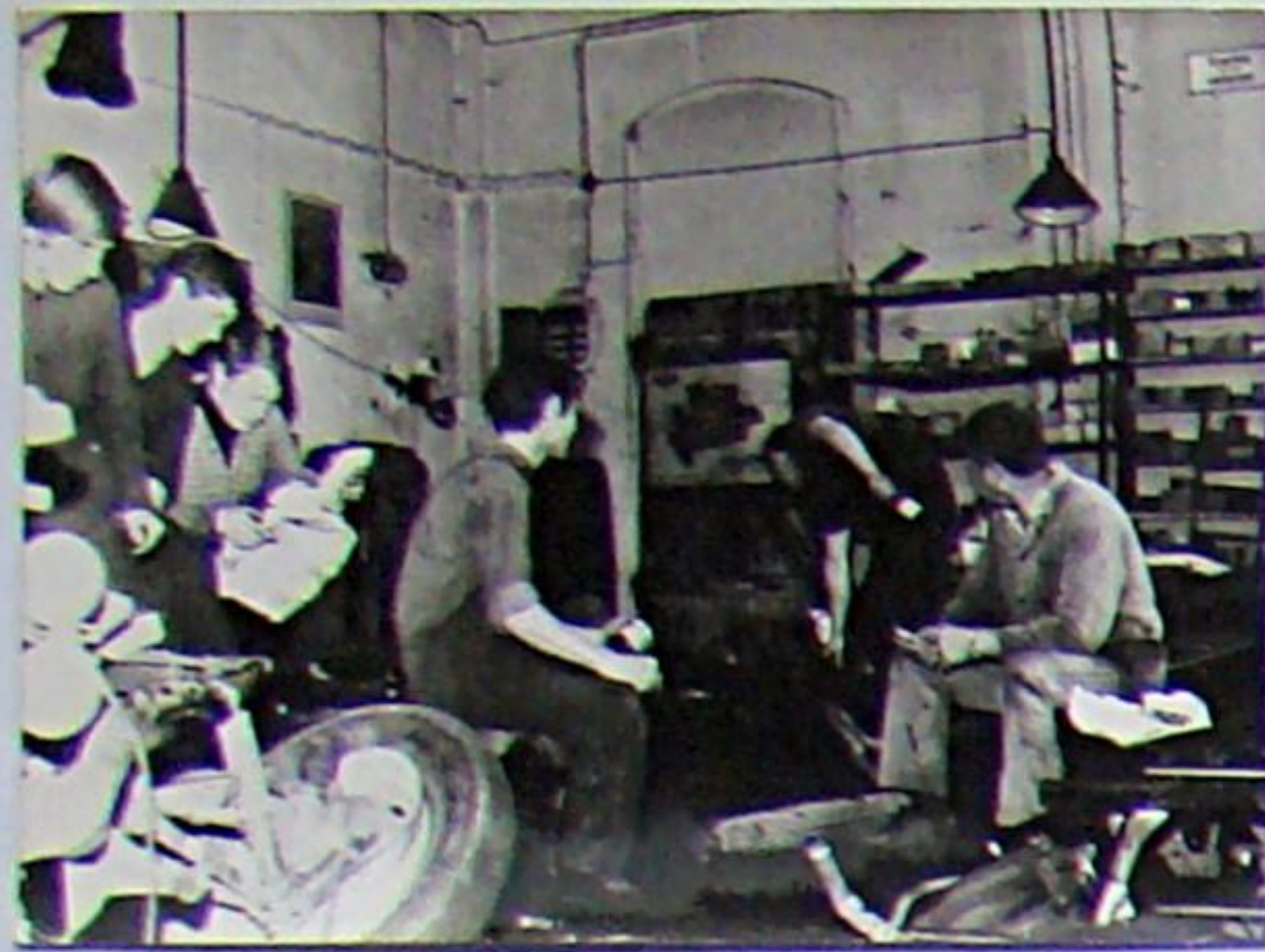
Erste Werkstatt der Außenstelle der PGH Motor Weimar in der ehemaligen Werkstatt der Fa. Wachtel, Weimarische Str. Nachfolgend als Lehrlingswerkstatt, später als Öl- und Schrottlager genutzt.