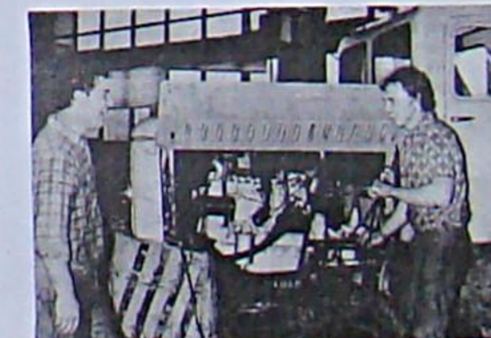
1971 ist und zu gehören die Gabelstapler aus der Sowjetunion und aus der CSSR zum Reparaturprogramm der PGH Kfz-Dienst in Bad Berka, die sich gerade auf diesem Gebiet spezialisiert hat.