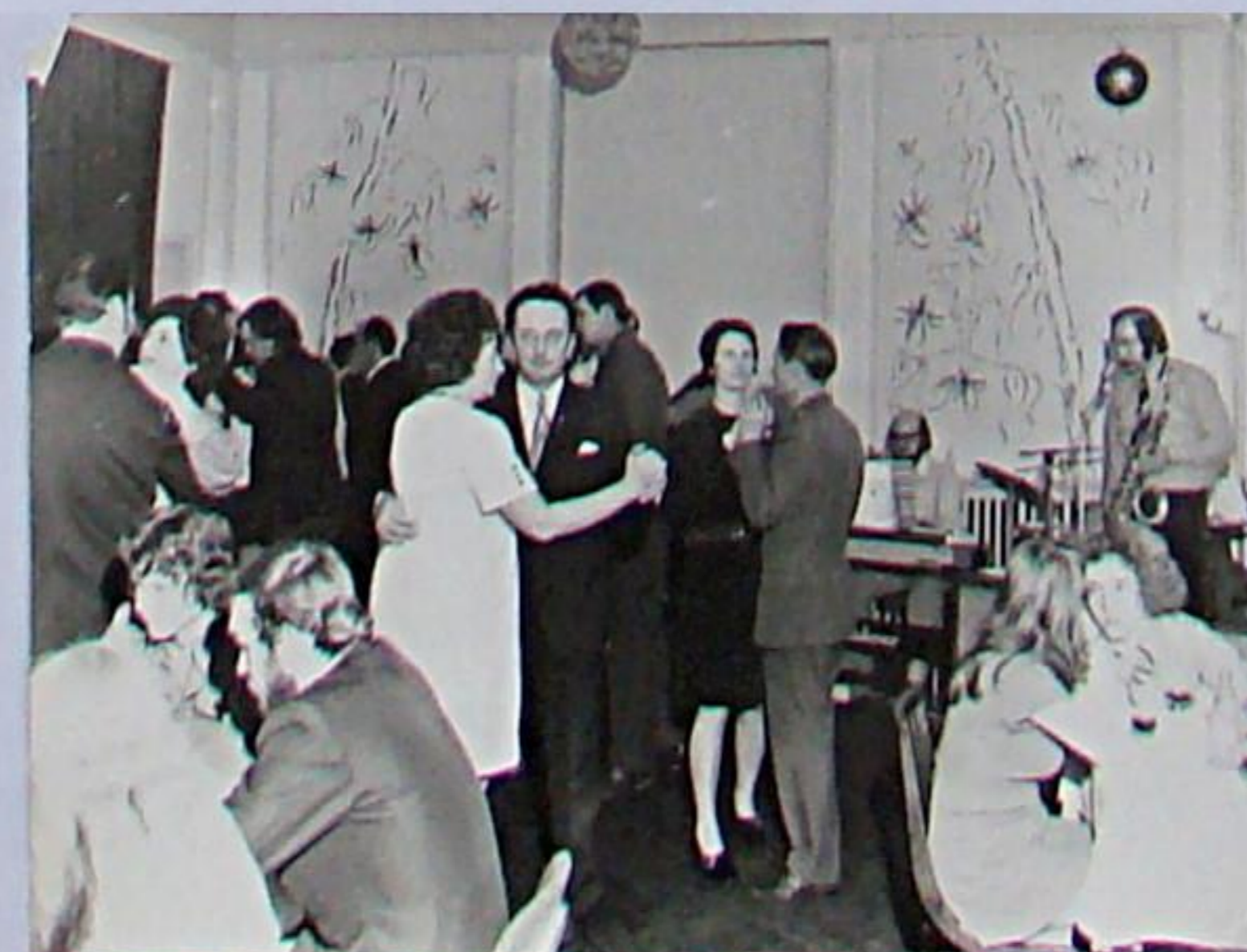
Betriebsfeier mit sowjetischen Freunden 1970er Jahre