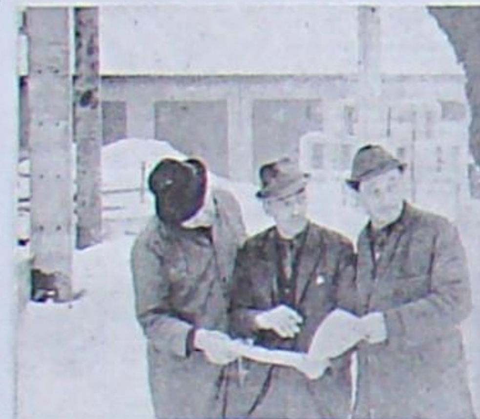
Ihren vom Vorstand der PGH Kfz-Dienst auf ihrer Dankeakte, der Köhlige Schürke, PGH-Vorsitzender Suck und Köhlige Tretz. Sie haben für das kommende Jahr für den Bau der neuen Werkstatthalle eine gute Ausgangslage geschaffen.