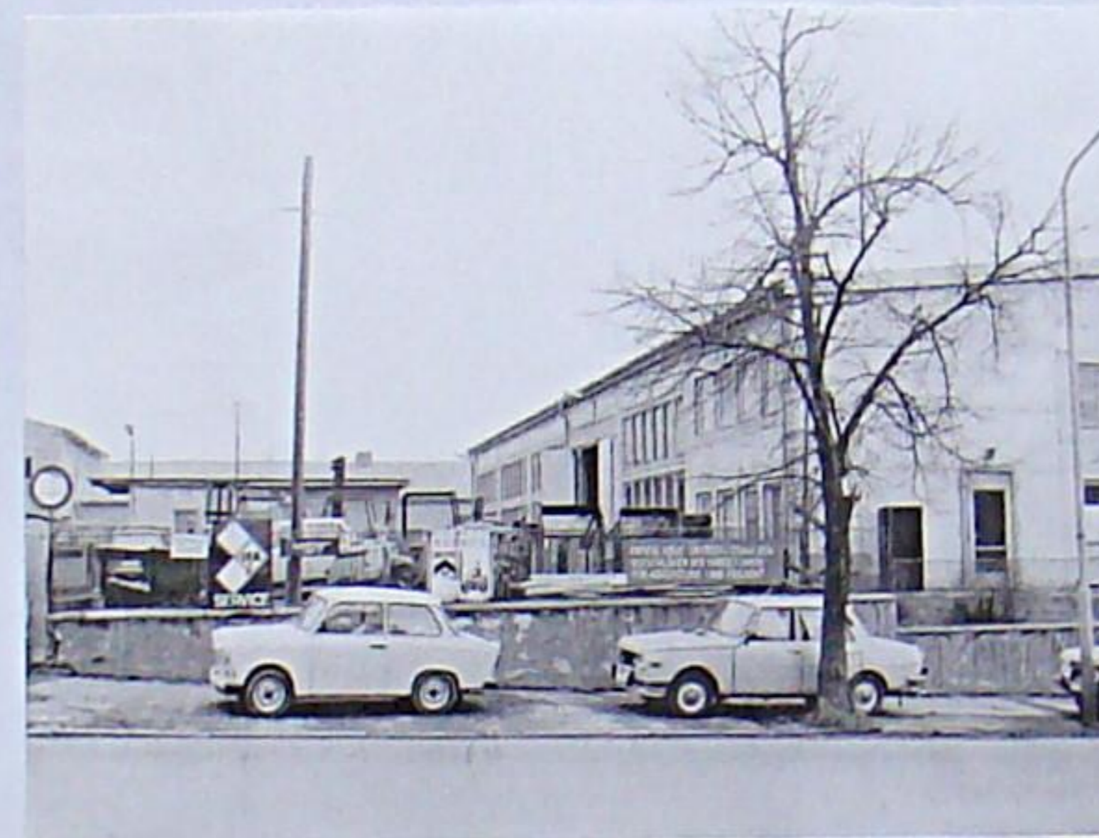
PGH Kfz-Dienst in der Weimarischen Str. 20 - 1985