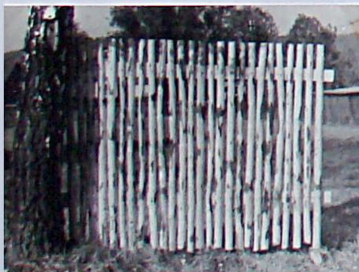
Produkte der PGH Bau-Holz ; u.a. Schweinepflanz- und -ställe, Gewächshäuser, Zaunmaterial