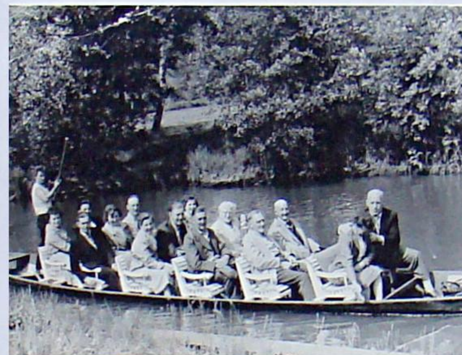
Mitarbeiter der PGH Hochbau beim Ausflug in den Spreewald 1959