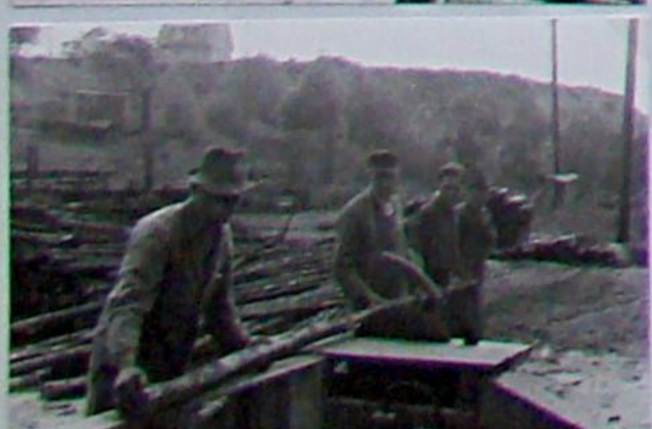
Auf dem Holzplatz der alten Ziegelei 1966