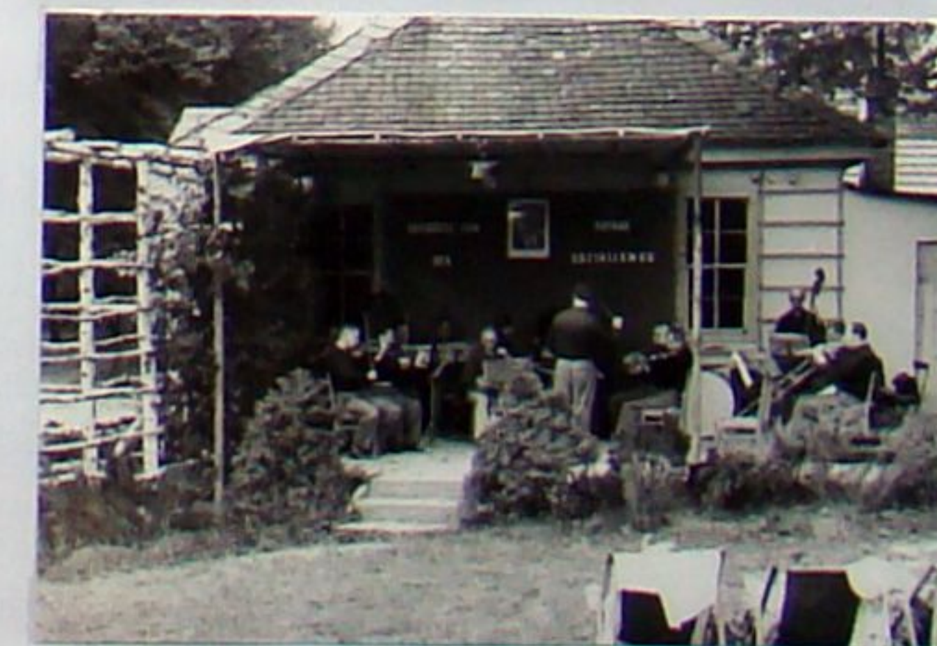
1952: „Musikmuschel“ an der Seitenwand des Schützenhauses (Die große Musikmuschel wurde erst 1956 errichtet.)