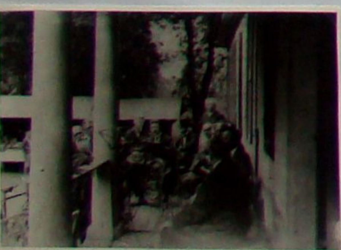
Musikalisches Ständchen zum Vogelschießen 1930