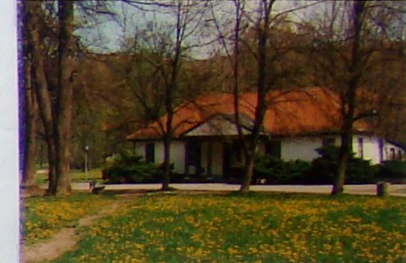
Schützenhaus 1991 noch mit verdecktem Giebel-Fries