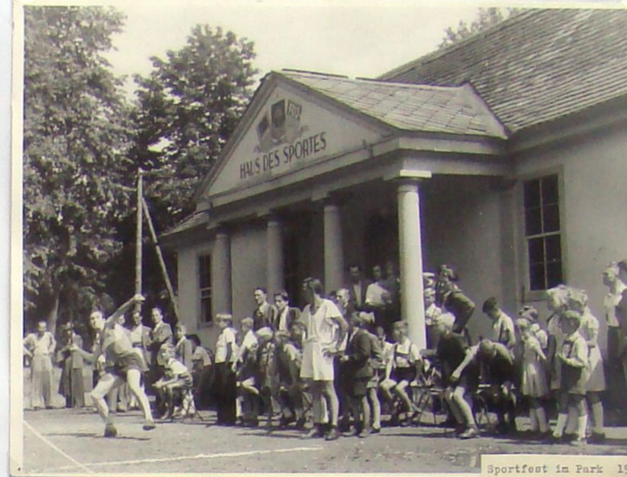
Schützenhaus als „Haus des Sports“ 1949