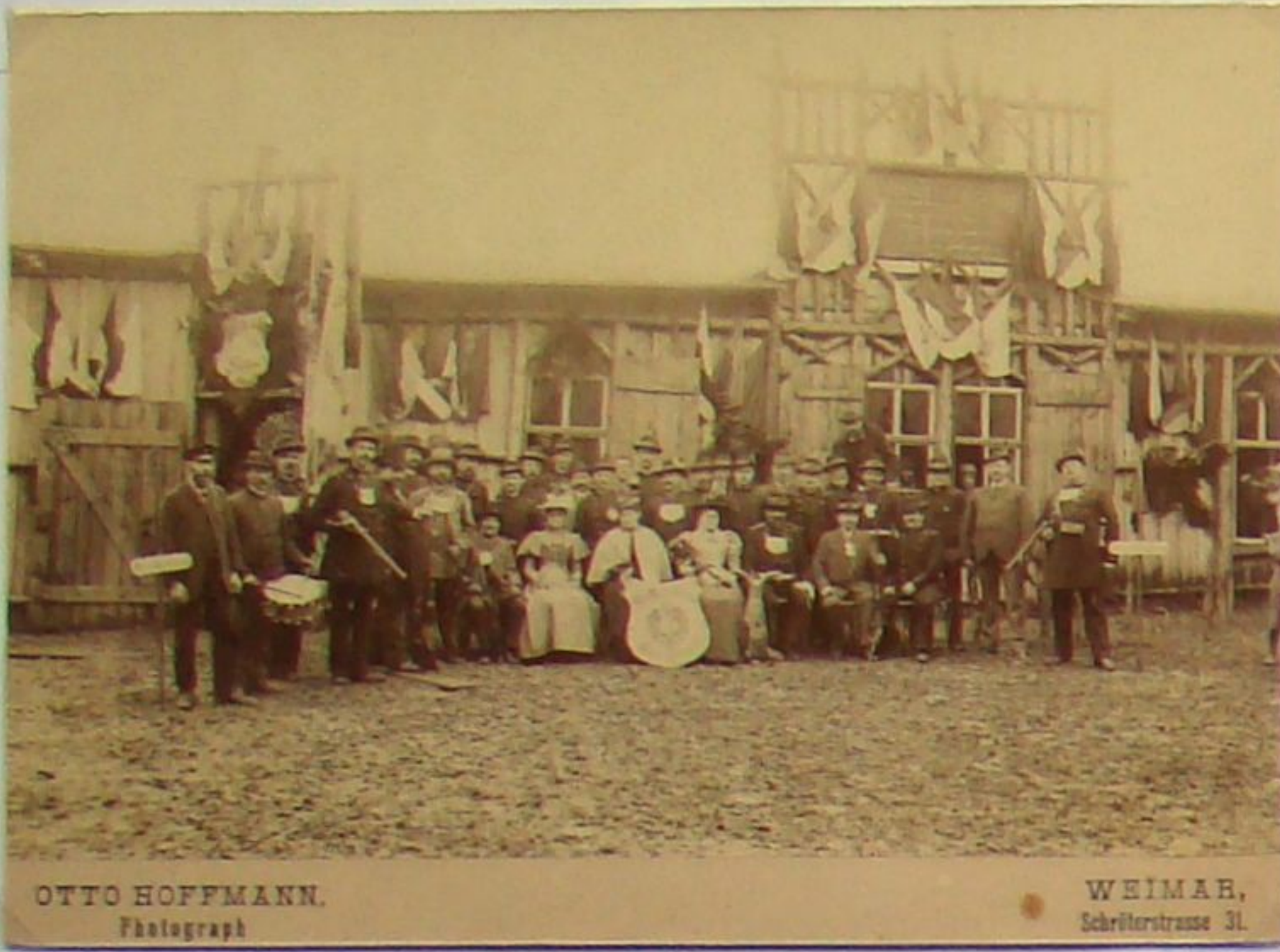
Festhalle des Berkaer Schützenvereins hinter dem Schützenhaus, auch „Punschbude“ genannt, um 1905

Das 1846 im Kurpark erbaute Schützenhaus war bei den Berkaern eher unter dem Namen Schießhaus bekannt, weil aus dem hinteren Teil des Gebäudes heraus auf Scheiben bzw. auf einen Vogel geschossen wurde. 1851 erhielt die Berkaer Schützengesellschaft die Schankkonzession, um zu dem jährlichen Schützenfest Bier verkaufen zu dürfen. Viele Jahrzehnte war das Schützenfest das größte und über mehrere Tage dauernde Volksfest in der Stadt, an dem nicht nur Berkaer, sondern auch Gäste aus dem Umland teilnahmen. Mittelpunkt des Festes war das heutige Schützenhaus im Kurpark mit der großen Festwiese, auf der man 1880 noch eine Festhalle errichtete, im Volksmund die „Punschbude“ genannt. Bei den Schützenfesten wurde nach Überlieferung oft so viel Bier getrunken, dass die Vorräte beider Berkaer Brauereien restlos aufgebraucht waren und der Gerstensaft von anderen Orten herangeholt werden musste.