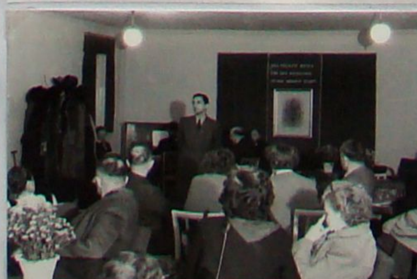
Eröffnung eines Klubhauses der Kurverwaltung am 7. Oktober 1953 im Schützenhaus