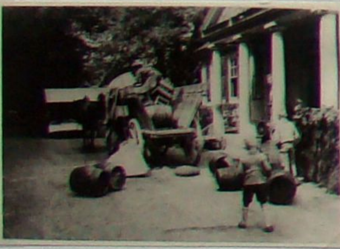
Abladen des „Zielwassers“ für das Vogelschießen 1930 vor dem Schützenhaus im Kurpark