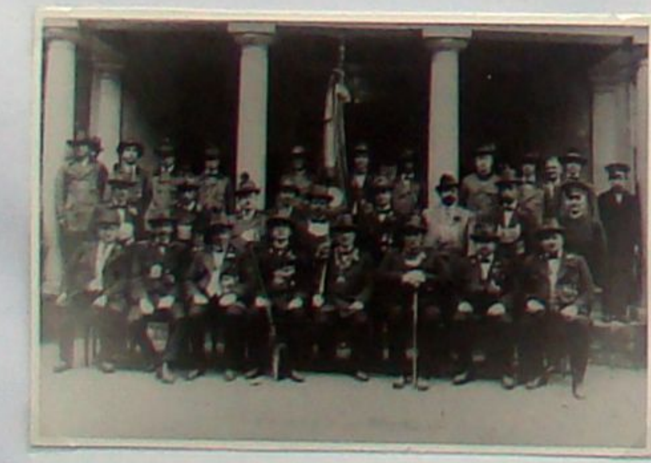
Bad Berkaer Schützenverein 1930