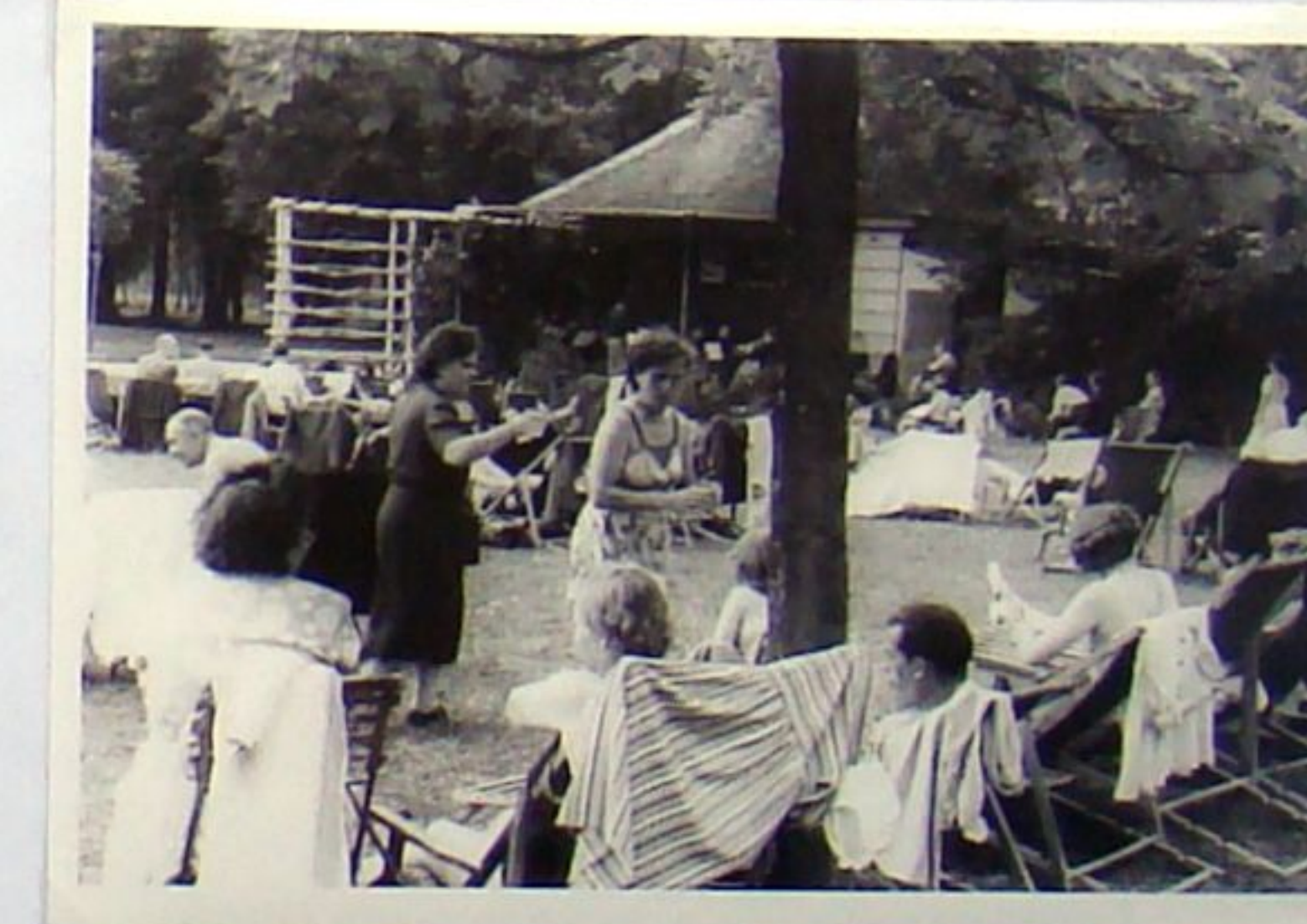
1952: Kurgäste auf der Liegewiese am Schützenhaus