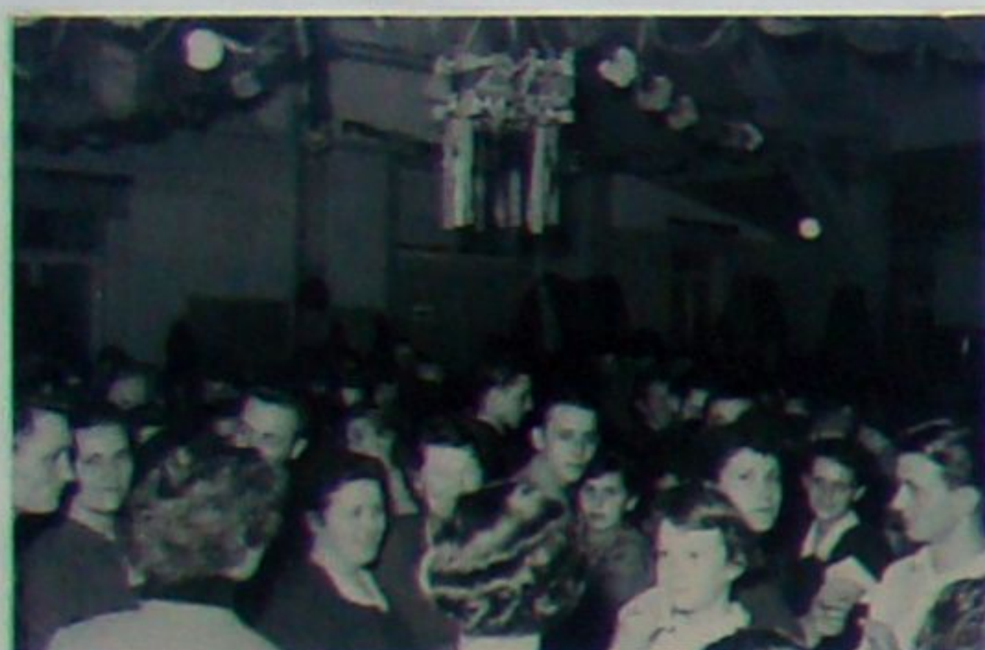
Feiern im Adlersaal um 1954