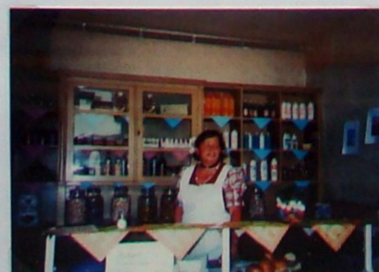
Wie in guten alten Zeiten öffnet der Heimatverein Tannroda hin und wieder zu besonderen Anlässen (wie hier zur 600-Jahr-Feier 2003) Böttcher, Lenes ehemalige Gaststätte.