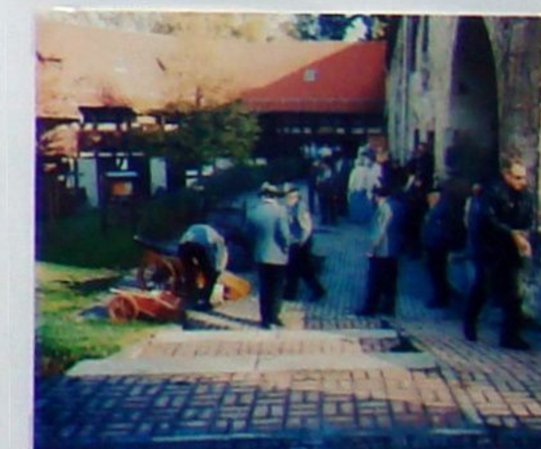
Böllerschüsse vom Schützenverein Tannroda zur Einweihung 2002