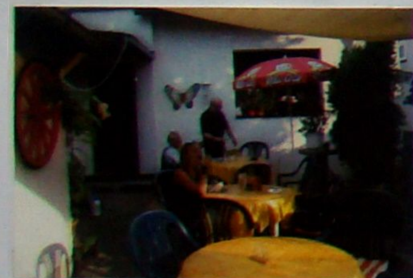
Unbedingt zu empfehlen ist bei sommerlichen Temperaturen die Einkehr im gemütlichen Eisgarten.