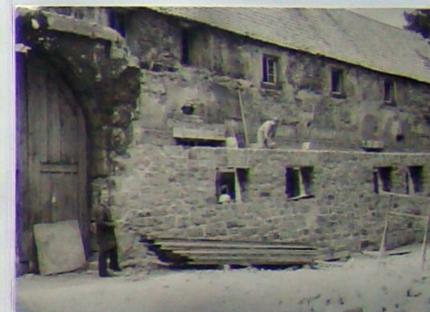
Bauarbeiten am Jugendklub 1988

1985 wurde in Nebengebäuden des Tannrodaer Schlosses auf dem Lindenberg ein Jugendklub ausgebaut. Nach dessen Schließung am 31. Dezember 1991 gestaltete man die Räume um und eröffnete am 14. Mai 1994 die „Schlossgaststätte Tannroda“. Ein Jahr brachte diese gastliche Stätte italienisches Flair nach Tannroda, schloss dann aber erneut am 21. Juni 1995. Wieder ein Jahr später, am 7. Juni 1996, öffnete sie als „Schlossrestaurant“ mit neuem Betreiber. Am 22. Januar 1998 sorgte ein Brand in der Gaststätte für Schlagzeilen. Erneute Schließungen und Betreiberwechsel folgten bis am 20. Oktober 2002 schließlich Familie Vogelsberg aus Tannroda die idyllisch gelegene und viel Flair ausstrahlende „Schlossgaststätte“ eröffnete. Doch auch dieses Unterfangen war nur von kurzer Dauer. Im Juli 2003 war wiederum Schluss. Seitdem steht die inzwischen der Stadt Bad Berka gehörende Gaststätte leer. Interessenten können sich im Rathaus Bad Berka melden.