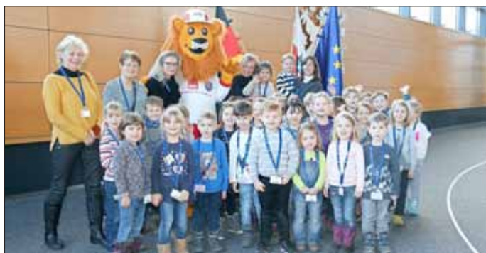
Kinder und Erzieherinnen der Kita „Am Adelsberg“ zu Gast im Thüringer Landtag.

Vorsitzender des Fördervereins der Kita „Am Adelsberg“ e.V.