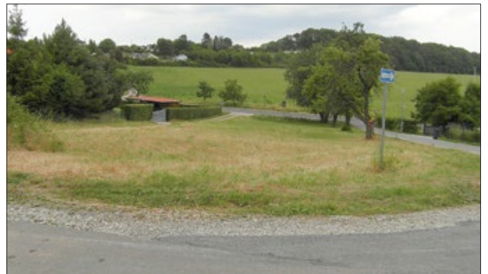
Blick auf die Baugrundstücke in Richtung Nordosten