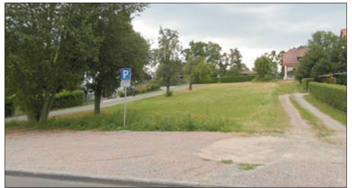
Blick auf die Baugrundstücke in Richtung Südwesten