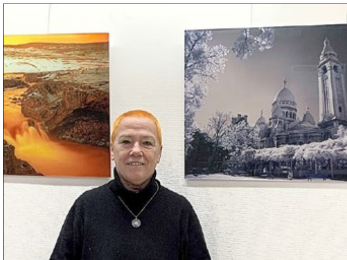
Das Bild zeigt den Wasserfall Godafoss in Island.

Der Wasserfall Godafoss in Island, die berühmte Kathedrale Sacre Coeur in Paris und das legendäre Casino Monte Carlo in Monaco sind nur drei von 27 Motiven, die seit Mittwoch, 11. Januar 2023, im Rathaus von Bad Berka im Rahmen der Ausstellung „Die Welt in Infrarot - eine ungewöhnliche Sichtweise“ zu bestaunen sind. Die großformatigen Fotografien, zum Teil auf Acrylglas gedruckt, entstanden im Laufe von mehreren Jahren während ihrer Reisen in verschiedene Länder und Städte, aber auch in der Nähe ihres Heimatortes. Die Fotos wurden von der Tiefengrubenerin Astrid Rippke in der aufwändigen und anspruchsvollen Technik der Infrarotfotografie aufgenommen und überraschen durch ihre verblüffenden Farbeffekte sowie mystisch anmutende Szenarien. Die Ausstellung in den Fluren des Bad Berkaer Rathauses kann bis zum 22.2.2023 zu den regulären Öffnungszeiten besucht werden.